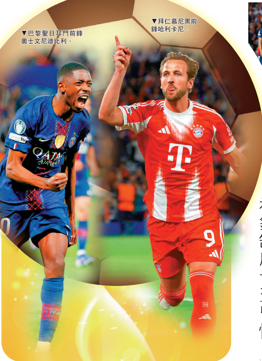
▼巴黎聖日耳門前鋒奧士文尼迪比利。