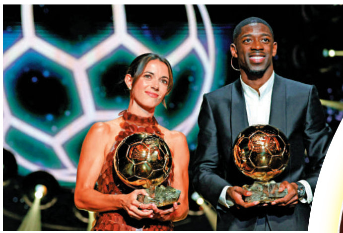
▲迪比利(右)2025年贏得金球獎。