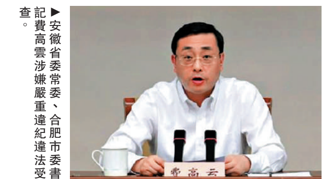
查記：安徽省省委常委、合肥市委書記費高雲涉嫌嚴重違紀違法，目前正接受中央紀委國家監委紀律審查和監察調查。

日本龍谷大學教授松島泰勝認為，否定東京審判的行為公然違背戰後國際秩序。在當前日本「新型軍國主義」抬頭背景下，為戰犯翻案的動向，實質上是企圖通過美化侵略歷史，為日本再度擴大軍事力量尋找精神支撐。松島強調，「如果任由這種為軍國主義招魂、企圖顛覆戰後共識的行徑發展，必將嚴重破壞亞太地區的和平與穩定。」