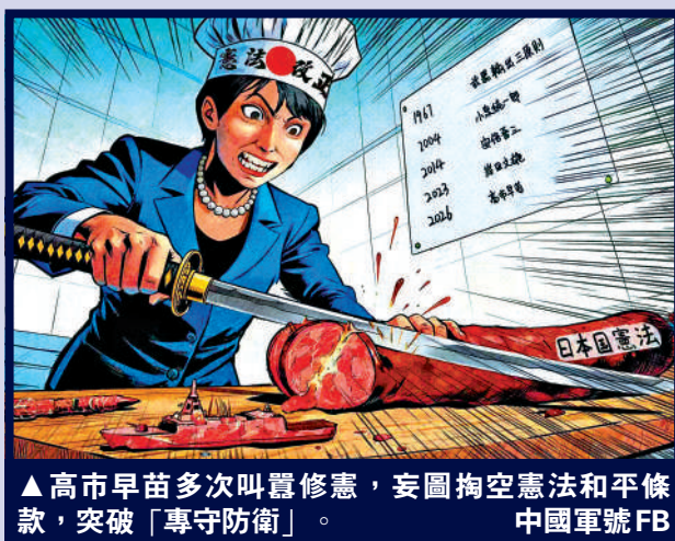
▲高市早苗多次叫囂修憲，妄圖掏空憲法和平條款，突破「專守防衛」。