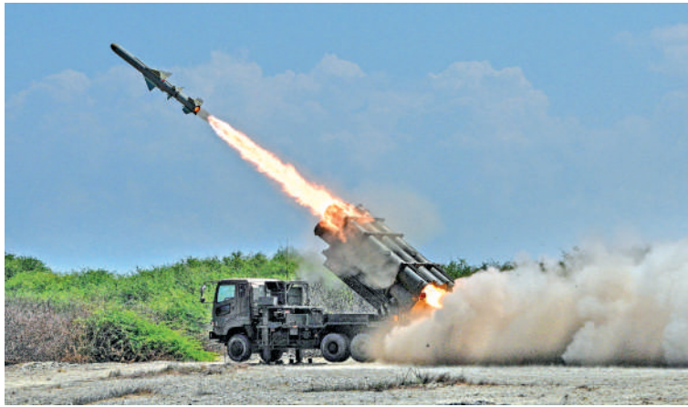
▲5月6日，日本的88式岸基反艦導彈在美菲「肩並肩」軍演中發射，日本蓄謀擴軍遭各界狠批。

對此中國外交部發言人林劍6日在例會上表示，日本曾對包括菲律賓在內的東南亞國家進行侵略和殖民統治，負有嚴重歷史罪責。在東京審判開庭80周年這一特殊年份，曾經的侵略者不僅未能深刻反省歷史罪行，反而打着所謂「安全合作」的幌子，向海外派遣軍事力量，發射進攻性導彈。這一動向再次說明，日本的右翼勢力正在推動日本加速「再軍事化」進程，不斷突破「專守防衛」和國際法、國內法相關規制。