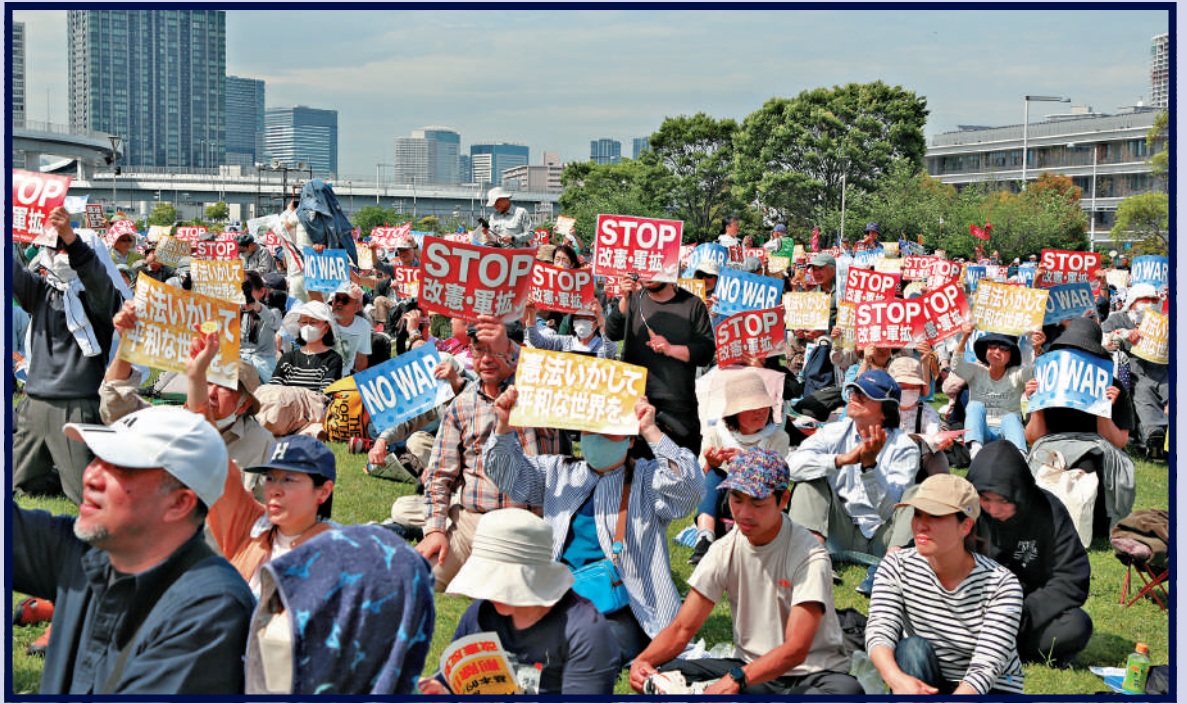
▲5月3日，約五萬名日本民眾在東京舉行守護憲法集會，呼籲堅持和平憲法、反對戰爭與軍備擴張。

張潔強調，日本炒作地區熱點問題，不利於地區和平。亞太作為全球經濟發展的重要引擎，其長期穩定的主要影響因素是經濟合作。然而，日美菲等有關國家轉向傳統安全議題，開展具有針對性和挑戰性的軍事演習，極易引發意外摩擦。日本加速擴軍，形同輸出戰爭，損害地區和平。