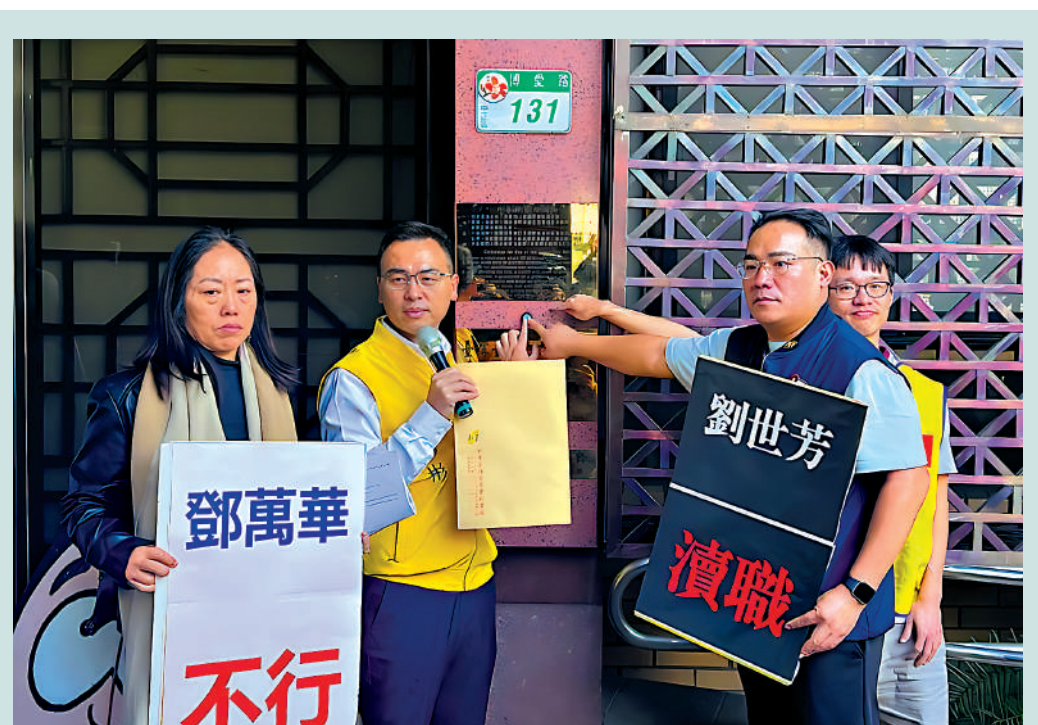
▲今年2月27日，大公報記者報道台當局內務部門負責人劉世芳的親屬在大陸投資謀利且為劉提供政治獻金，揭露劉世芳只許親屬「賺紅錢」、不許民眾搞交流。圖為新黨人士去年12月到台北地檢署告發劉世芳涉瀆職罪。資料圖片

2025年3月26日 ● 民進黨當局內務部門負責人劉世芳被大陸方面列為「台獨」打手幫兇。