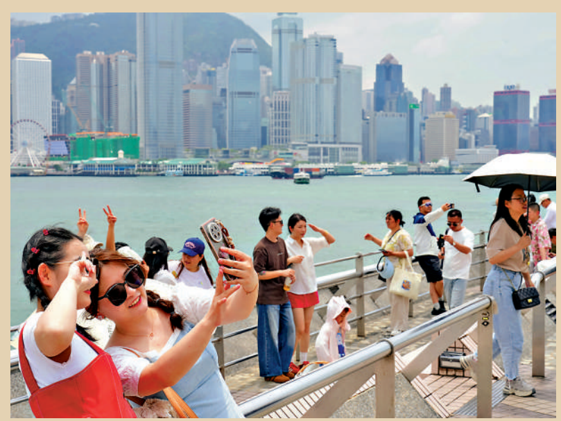
▲內地五一黃金假期，共逾101萬人次內地旅客訪港，較去年上升10%。

820個內地入境旅行團、逾3.2萬人次訪港，過夜行程佔約60%，旅行團數目與去年同期相若。其間酒店入住率整體達到90%，較去年略高；房價則較以往長假期上升一成。