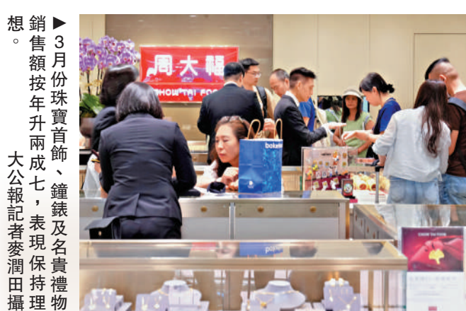
3月份珠寶首飾、鐘錶及名貴禮物銷額按年升兩成七，表現保持穩健。