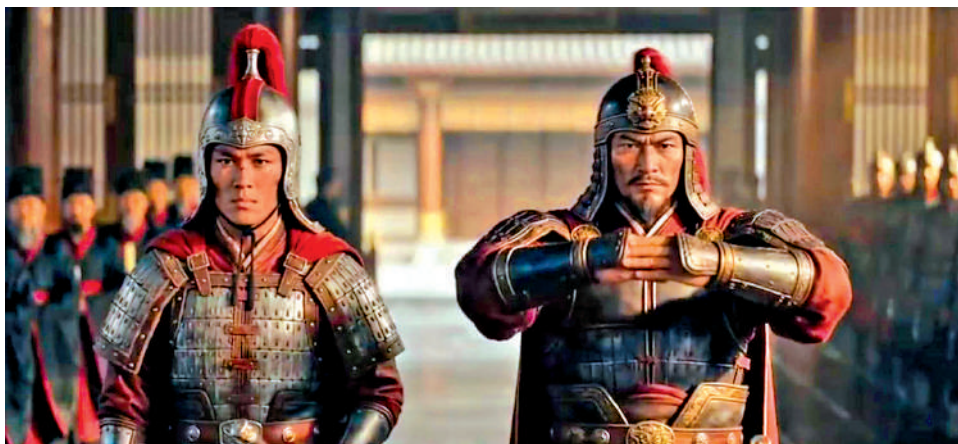
▲2月底，AI短劇《霍去病》以號稱3000元人民幣的成本獲得5億的播放量。

事實上，今次AI演員庫的風波，更多呈現出的是主流視頻平台面對即將到來的行業蛋糕再分配的心急與焦慮。麥卡錫今年發布的關於人工智能對電影和電視製作以及產業未來影響的報告提到，未來AI極大可能改變的是影視行業的產業結構和利潤分配：從舞台劇到電影、從線性電視到串流媒體、從長篇內容到短篇內容的轉變，在科技被廣泛應用後的五年內，都導致現有內容提供者的收入平均下降了35%。愛奇藝、優酷、騰訊視頻、芒果TV四