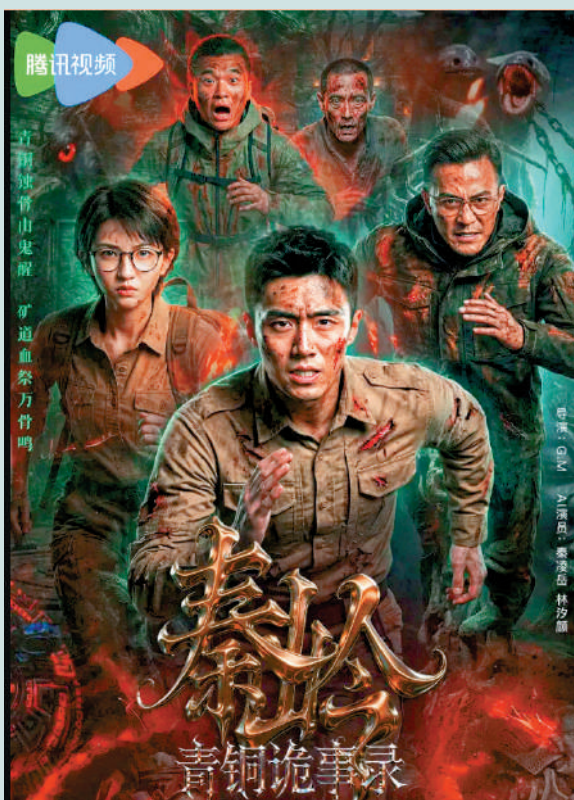
▲騰訊視頻與耀客傳媒合作推出AI短劇《秦嶺青銅詭事錄》。