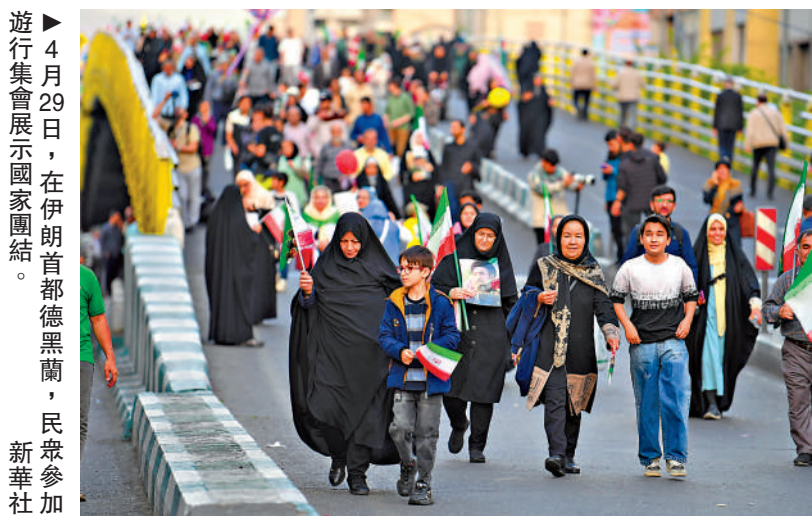
4月29日，在伊朗首都德黑蘭，民眾參加遊行集會展示國家團結。