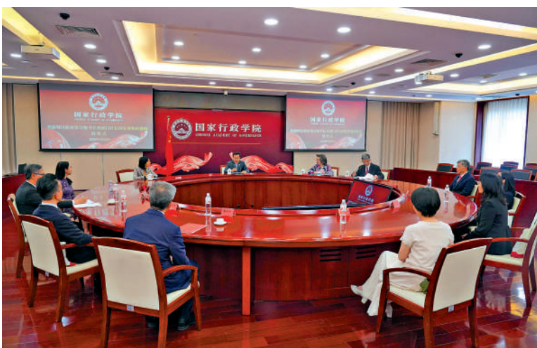
位於北京的國家行政學院，是港人北上研習國情的熱門地點。

【大公報訊】記者王蕙如報導：立法會主席李慧琼昨日見傳媒時透露，正籌劃安排全體議員，7月休會期間到北京參加國情研習及考察班。而被問及今屆立法會首設發言人制度，李慧琼表示設發言人制度合情合理，在外界亦常見。