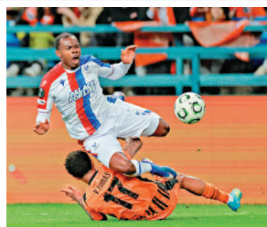
3:1擊敗薩克達。水晶宮(白衫)首回合以

水晶宮於英超已護級成功，可全力出戰歐洲賽，論球員質素明顯更勝一籌，首回合客3:1輕取對手，門前把握力成勝負分野，有望憑主場之利再贏。薩克達雖是烏克蘭聯賽榜首，始終整體實力大有差距，首回合完全被擊倒，球隊實力見底，要在客場反勝晉級甚有難度。