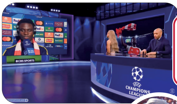
▲阿仙奴名將亨利(右)賽後以視像訪問沙卡。電視截圖