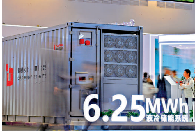
▲隨着各國加速推進可再生能源的本地化部署，無疑也會推升對鋰、鈷、鎳、銅等關鍵金屬的產能需求。

今次中東衝突爆發以來，伊朗充分運用了非對稱作戰手段，切斷霍爾木茲海峽的石油出口通道，