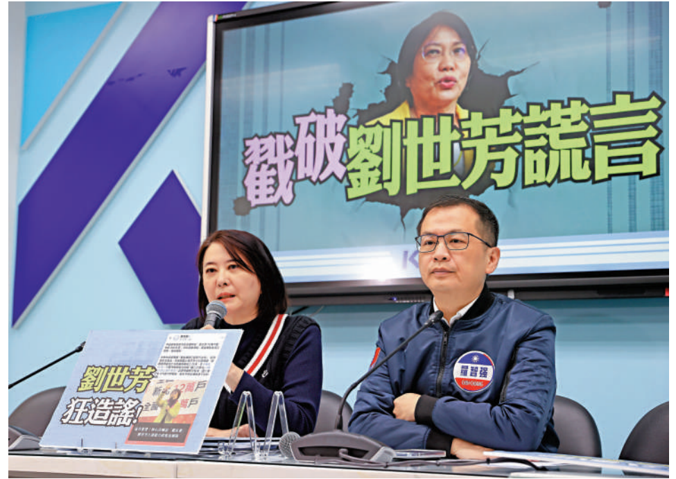
▲台當局內務部門負責人劉世芳宣揚「台獨」、破壞兩岸關係，可謂臭名遠播。圖為國民黨召開記者會，批評劉世芳造謠抹黑在野陣營。