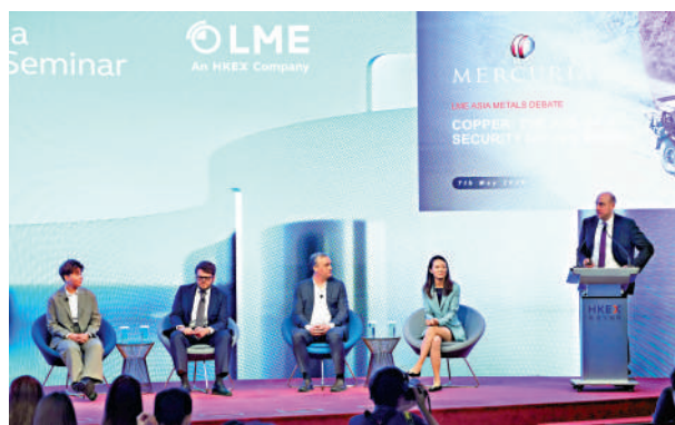
▲LME亞洲金屬研討會2026昨日在港舉行。

國家「十五五」規劃首次明確支持香港發展大宗商品交易生態，香港可憑「一國兩制」優勢，發揮自由港、低稅制及國際金融中心地位，成為連接內地與國際市場的重要樞紐。目前香港正在推進多項措施，目標是把香港建設成為集交易、物流、融資和定價功能的國際大宗商品交易中心。