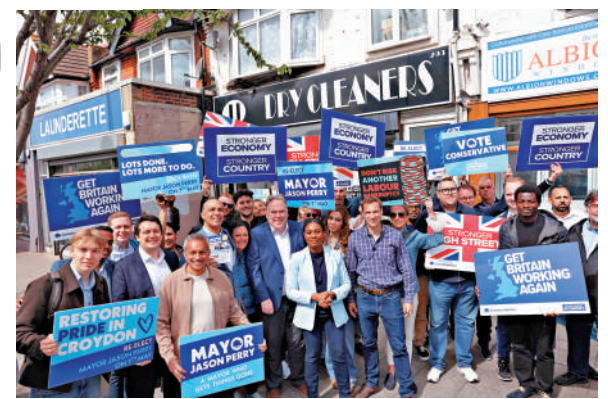
英國保守黨黨魁巴德諾克等人6日在倫敦拉票。

英國7日舉行地方選舉，預計將於當地時間8日公布結果。最新民調顯示，傳統兩大黨工黨和保守黨或均迎來慘敗，尤其是工黨，可能會損失約8成席位，而極右翼改革黨席位有望大幅增加。本次地選也被視為工黨自2024年大選獲勝後的首次重大政治考驗，首相斯塔默低迷的支持率恐令其再度面臨逼宮壓力，而英國政府也可能從「兩黨」轉向「多黨」時代。