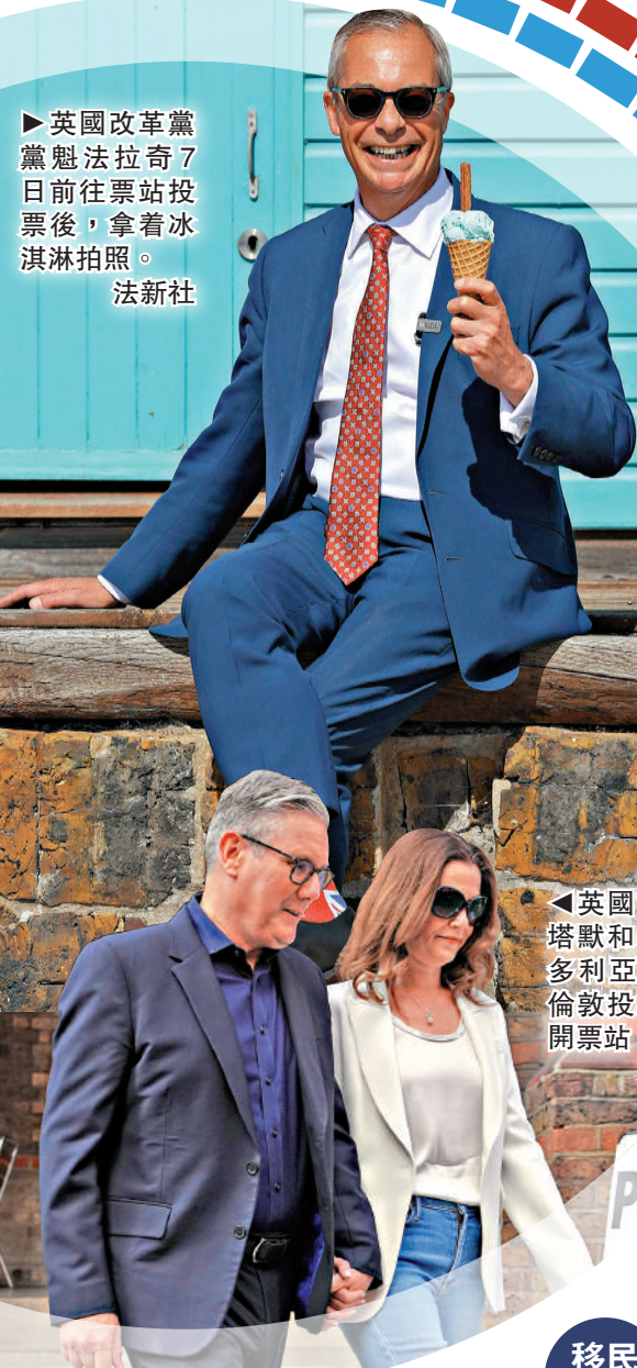
英國首相斯塔默和妻子維多利亞7日在倫敦投票後離開票站。