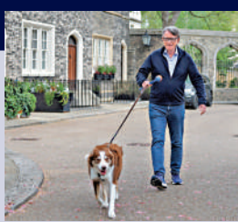
4月20日，前英國駐美大使曼德爾森在其住所外遛狗。

英國政府早前公布的文件顯示，在2024年12月任命曼德爾森為駐美大使之前，斯塔默已被警告，曼德爾森與愛潑斯坦關係密切。曼德爾森在獲得任命後未通過安全審查，但英國外交部當時決定推翻審查結果，使其順利赴任。