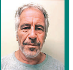
▲美國法官6日公布一份據稱是愛潑斯坦寫的遺書。