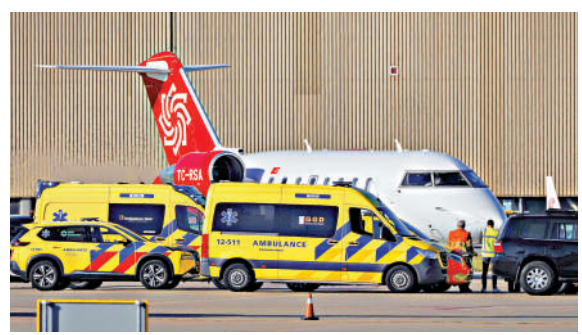
▲載有一名感染漢坦病毒患者的飛機7日抵達荷蘭阿姆斯特丹史基浦機場。

阿根廷南部旅遊城市聖卡洛斯-德巴里洛切6日也確診一例漢坦病毒感染病例。阿根廷方面正追蹤感染源頭，懷疑郵輪上的2名死者、即一對荷蘭夫婦，曾在阿根廷接觸過老鼠。