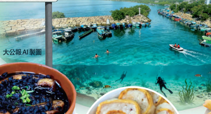
大公報 AI 製圖

CAPE OF SHA TAU KOK 角之角頭沙 北緯 22° 32' 37" N 東經 114° 13' 35" E