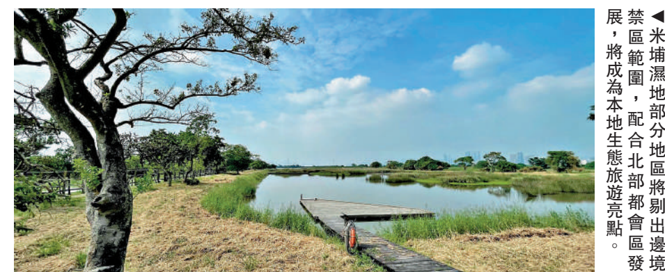
▲米埔濕地部分地區將剔出邊境禁區範圍，配合北部都會區發展，將成為本地生態旅遊亮點。

序，待立法程序完成後，《修訂令》和《修訂公告》將於2026年7月24日起實施。實施後，除過境設施及邊界巡邏路外，所有的邊境禁區會予以開放。