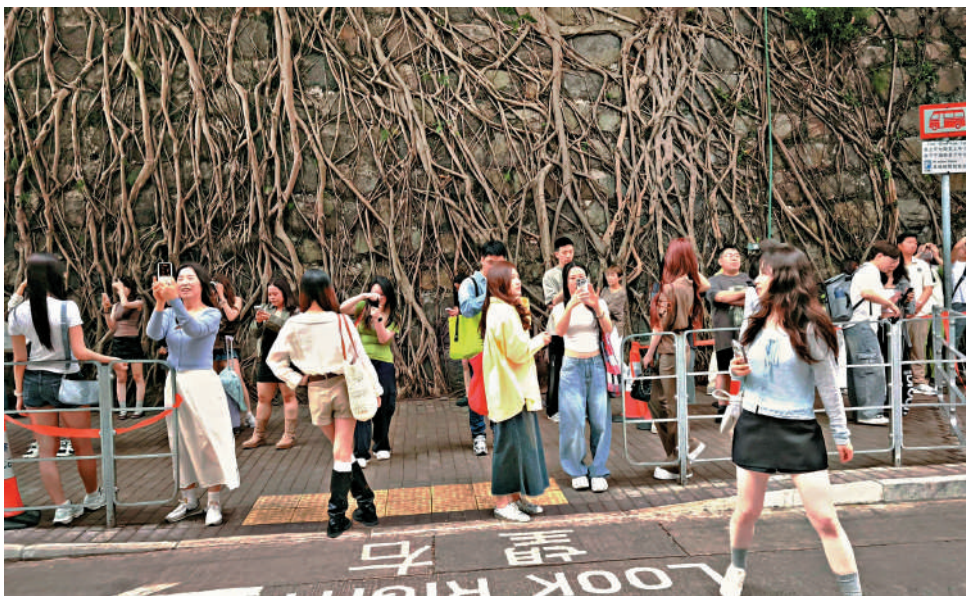
▲西環科士街與爹核士街交界的百年石牆樹,近年已成為不少來港旅客的打卡熱點。

西環科士街與爹核士街交界的百年石牆樹,近年已成為不少來港旅客的打卡熱點,許多遊客聚集在科士街拍照,除了欣賞這列全港最長的石牆樹,對面的招牌更是他們打卡的焦點。五一黃金周期間,西區警方曾聯同關愛隊在該打卡點向拍照打卡的市民及遊客派發宣傳單張,推廣道路安全意識。