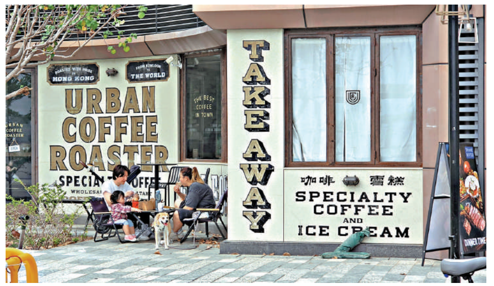
放寬狗隻進入食肆的修訂規例今生效,合資格食肆可於本月十八日起向食環署申請牌照。

《2026年食物業(修訂)規例》將於今日正式生效,但食肆必須先提出申請,獲批准才可以讓狗隻進入。政府昨日公布更多細節,食肆本月18日起可以開始申請,首階段名額1000個,若申請超額會抽籤,首輪牌照在6月中旬批出。申請的食肆面積必須大於20平方米,火鍋店和烤肉店不准申請,牌照條件將列明狗隻不准上餐桌、要用不超過1.5米的狗繩牽引等。