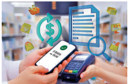
▲消委會測試港人較常用的5款電子錢包,發現若將信用卡連結至電子錢包進行付款,或被徵收手續費。

用電子錢包轉賬雖快捷易用,但假如不慎輸入錯誤的收款人資料,則會轉移至錯誤賬戶。消委會調查顯示,大部分錢包不支援付款人自行撤銷相關轉賬,只有PayMe在轉賬獲確認前可由付款人自行取消。WeChat Pay HK平台內的轉賬,可由收款人主動退還款項,若收款人在24小時內未確認收款,款項將會自動退回到付款人之賬戶。經轉數快轉賬的資金會即時到賬,付款人不能自行撤銷已生效的交易。