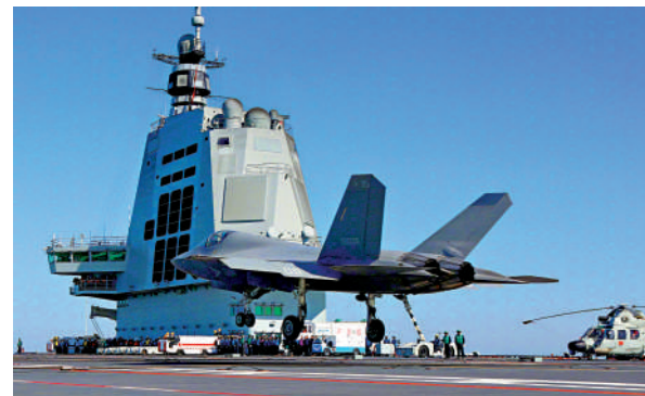
海軍的殲-35去年完成在航母福建艦上首次彈射。

「作為一線部隊戰鬥員，我們非常清楚未來戰場對戰機的需求。」殲-35A飛行員表示，殲-35A與殲-20強強聯合、功能互補，大幅提升體系作戰的整體效能。 新華社