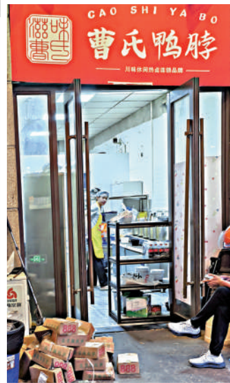
▲在白象街無堂食外賣點，有外賣騎手表示商家已加強衛生管理，但也存在雜物亂堆亂放的問題。

◀整改後的白象街曹氏鴨脖外賣店，衛生問題得到改善，但仍有關於食品衛生的新增差評。