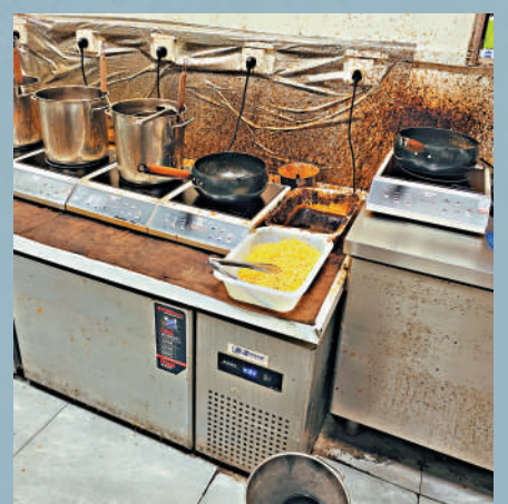
▲今年初，未整改前的白象街曹氏鴨脖外賣店，整體環境比較糟糕。