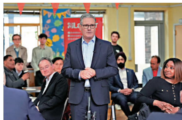
▲英國首相斯塔默8日在倫敦向工黨成員發表講話。

在英國2029年舉行下屆大選前，本次地方選舉被視為最具指標性的民意測試，也是斯塔默政府的「期中考試」。截至8日晚，根據逾六成的初步計票結果，工黨在英格蘭多地損失慘重，已丟失了774個議席，失利範圍包括傳統上是工黨票倉的英格蘭中部與北部前工業地區，以及倫敦部分地區。