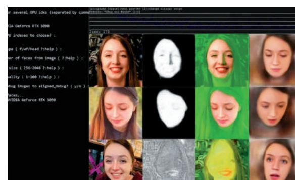
▲歐盟準備出台《人工智能法案》，禁止使用「深偽技術」生成色情圖片。

「深偽」泛指利用AI技術生成或修改極其逼真的影像、聲音等。此前，內置於美國企業家馬斯克旗下社交媒體平台X的AI聊天機器人「Grok」被指生成色情內容，引發廣泛譴責。根據人工智能取證組織報告，2025年12月25日至2026年1月1日，在「Grok」以深度偽造方式產生的2萬張圖像中，55%的人物圖像穿着暴露，其中81%是女性；2%的圖像中人物年齡不足18歲。