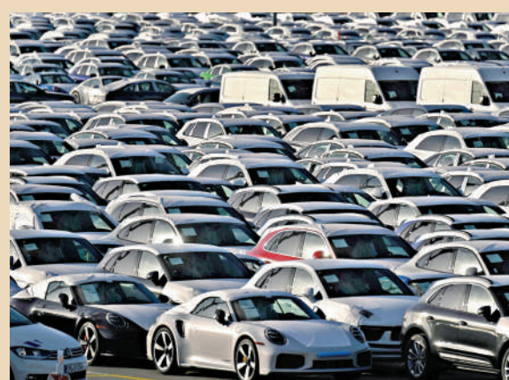
▲德國西北部埃姆登的大眾汽車工廠。

機制變得更加必要。特朗普當天在社交媒體發文稱，他當天與歐盟委員會主席馮德萊恩進行了「非常好的通話」。他還說，歐盟已經承諾將履行雙邊貿易協議並把美國輸歐產品關稅降至零，他一直在耐心等待歐盟方面履約。稍早前，特朗普1日通過社交媒體威脅說，由於歐盟沒有遵守與美國的雙邊貿易協議，美國準備把歐盟輸美汽車關稅從15%提高至25%。