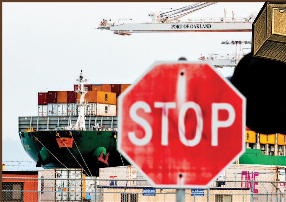
▲停泊在美國加州奧克蘭港的貨船。

美國國際貿易法院7日公布裁決，認定特朗普政府在今年2月份根據《1974年貿易法》第122條徵收10%全球進口關稅的法律依據不成立。法院還命令政府連本帶利退還相關進口商已繳納的關稅。美媒指，法院判決再次對特朗普政府的關稅政策造成打擊。不過，特朗普已着手採取行動，可能通過「301調查」等方式，繼續徵收關稅。