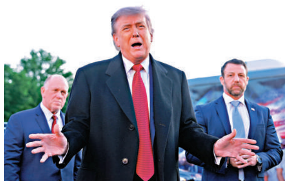
▲美國總統特朗普7日在華盛頓參觀林肯紀念堂發表講話。

【大公報訊】5月7日，位於曼哈頓的美國國際貿易法院3名法官，以2比1的投票結果，裁定總統特朗普2月援引第122條，對幾乎所有國家的進口商品徵收10%的法律依據不成立。特朗普以「美國存在巨大貿易逆差」為由，為其全球徵收10%關稅措施辯護。但是，根據第122條，只有當美國出現「巨額且嚴重的國際貿易赤字」時才能徵收關稅，法院認為，這與當局宣稱的「貿易逆差」不相同。法院判決，全球關稅已明顯超出總統行政權限範圍，在法理上站不住腳，關稅須撤回。