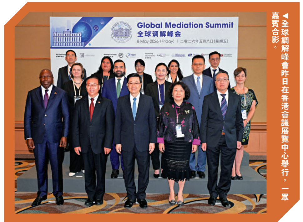
▲全球調解峰會昨日在香港會議展覽中心舉行，一眾嘉賓合影。

鄭若驊強調，調解完全尊重當事人意願，任何一方都可以隨時離開調解。此外，調解過程是保密的，所有內容都「不損害權利」，這讓大家可以很放開地去嘗試調解，如果成功當然很好，即