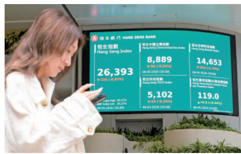
▲恒指昨回吐232點，但全周累升617點。

內房股續成焦點。華潤置地（01109）升3.5%，報36.76元，創新高；綠城中國（03900）升5.7%，報10.95元；龍湖集團（00960）升5.5%，報9.15元；中國海外（00688）升2.8%，報15.92元。晨星表示，市場對內房行業重燃樂觀，但提振政策或短暫，全國新房銷量及價格可能明年才反彈。晨星預期內地將推出更強措施，如向購房者發放現金、降低按揭成本。晨星首選中國海外及華潤置地，因兩者自2022年下行周期以來銷售增長及淨負債均優於同業。其他個股方面，快手（01024）升9.4%，報52.95元，為升幅最大藍籌；港股通淨買入17.47億元。其可靈AI推出視頻3.0模型，支持原生4K直出，為業界首創。