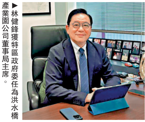
林健鋒獲委任為洪水橋產業園公司董事局主席。

【大公報訊】發展局昨日公布，經獲行政長官批准，政府委任林健鋒為洪水橋產業園有限公司（洪水橋產業園公司）董事局主席，並委任五名官方和五名非官方董事局成員，任期三年，今年6月起生效。