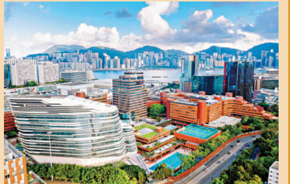
▲理工大學約 4.2 萬學生及員工受影響，校方表示已向私隱公署通報。