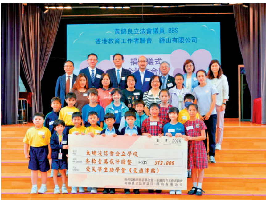
▲教聯會昨日向受災學童就讀的學校轉交 31.2 萬元善款。

教聯會主席、立法會議員黃錦良表示，除交通津貼外，火災發生後，教聯會亦動員 200 名心理學家及社工為學童提供情緒支援，同時為大埔浸信會公立學校籌得 50 部電腦設備，以滿足學習需要。今次捐款由他主動聯繫內地慈善機構及鍾山公司促成，屬於第一階段支援，日後會持續跟進。