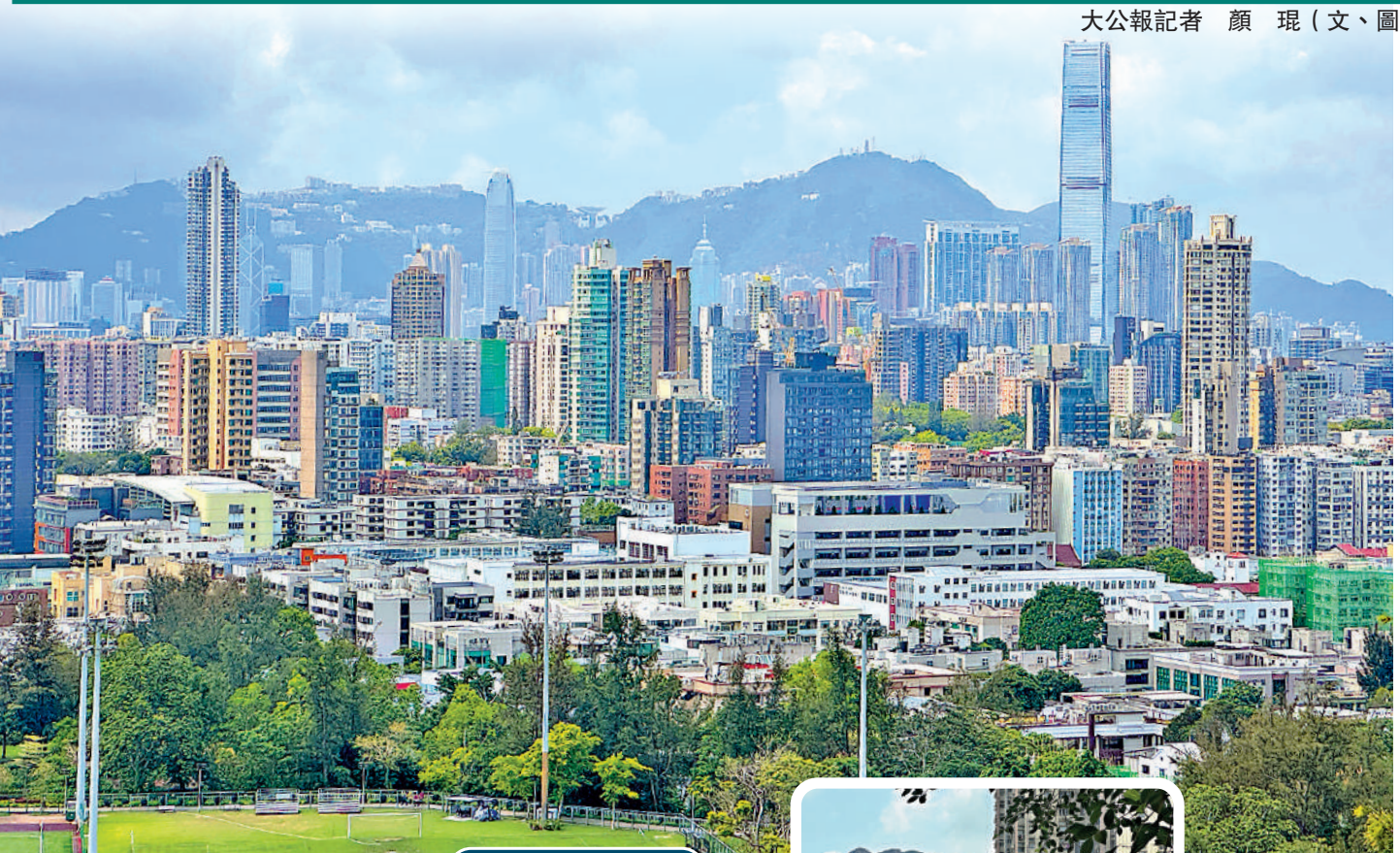
在格仔山上俯瞰九龍城舊唐樓和遠望維港兩岸的景觀。