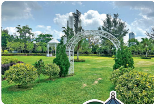
九龍仔公園內的洋紫荊園極具特色。