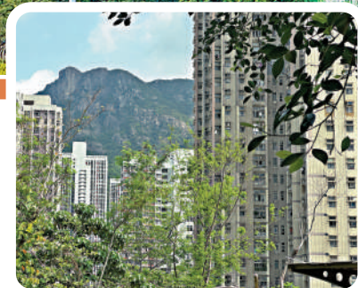
樂富配水庫休憩花園