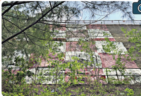
格仔山上的打卡位紅白格圖案。