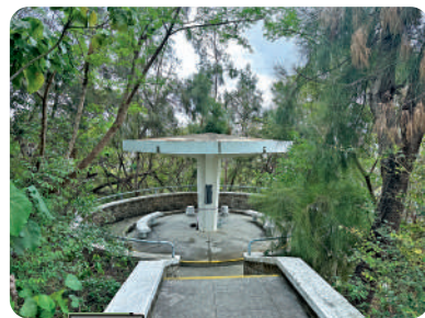
涼亭很有懷舊特色。