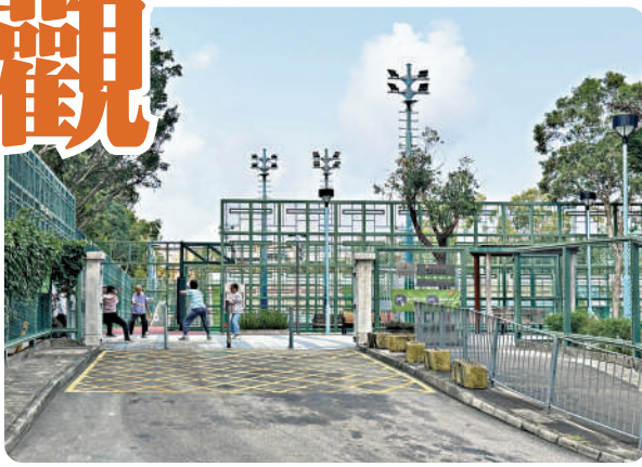
附近的市民在公園旁晨練。