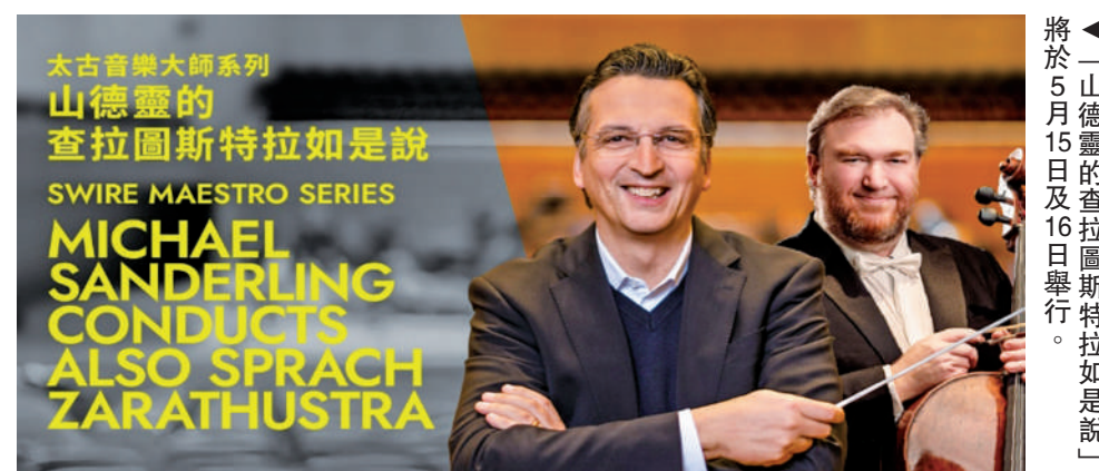
▲山德靈的查拉圖斯特拉如是說將於5月15日及16日舉行。

「紀弗朗的貝多芬鋼琴協奏曲全集I及II」將分別於5月22日晚上7時30分及5月23日下午5時，於香港大會堂音樂廳舉行。