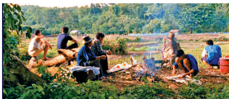
▲里爾吉迪拉瓦尼：《繆叔拜訪他的鄰里》劇照。

「空間 進入 轉移」呈獻一系列多元的流動影像作品，運用構圖、視角、疏離與抽象的手法，並結合鏡頭與聲音技術，引領觀眾以不同層次想像與感知空間——從臥室的私密到宇宙的浩瀚。電影節穿梭於純淨的自然景觀、密集的混