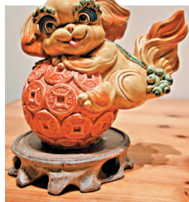
▲鍾婉堯設計的可愛陶靈獸。