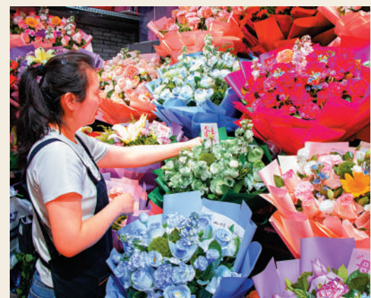
▲母親節到了，各地鮮花消費升溫。

讓母親回到十八歲，回到一切都能重新開始的年紀，從頭經歷一個女孩本應擁有的一切，他用整整十個「不讓」企圖阻隔厄運對母親的侵犯與凌辱，用自己的心疼去共情母親遭遇的所有痛苦。與此類似的書寫還有艾倫·金斯堡的《卡迪什》，其副標題即「為娜奧米·金斯堡（1894-1956）而作」，而娜奧米正是詩人的母親，她於二十世紀初從沙皇俄國來到美國，一生都是左翼運動的熱情參與者，但也經歷了不斷的幻滅挫折，最後在精神錯亂中離開人世。相比保守的父親，顯然母親給了金斯堡更為深切的影響，其悲劇命運也成了他瘋狂詩歌的一個化不開的內核。《卡迪什》引述了母親離世前給金斯堡留下的一張字條：「鑰匙在窗台上，鑰匙在陽光下——我有鑰匙——結婚吧，艾倫，別吸毒——鑰匙在窗台上，鑰匙在陽光下，鑰匙在老地方。」你看，無論在多麼混亂悲慘的命運中，母親最後能夠留給孩子的，總是最樸素的渴望，健康、安寧，擁有陽光和被陽光照亮的空間。