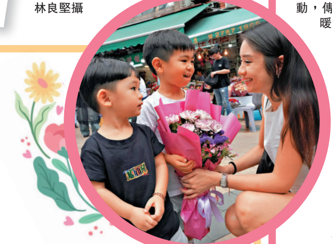
▼昨日母親節，有媽媽收到兒子送贈的花束，高興不已。

孟子的母親，她的形象最有條件成為中華母親節的代表，只是農曆四月初二——孟母誕下孟子的日子，這個具體日期大眾知曉度不高，還需要長期的宣傳與普及，無法一蹴而就。」