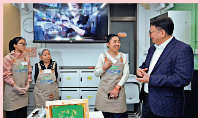
▲陳國基探訪基層媽媽，呼籲市民共築敬老愛幼的美好社會。

行政長官李家超在社交平台發布一張以人工智能(AI)設計生成的賀卡，祝願大家母親節快樂。該張賀卡畫有李家超與太太林麗嫻，以及兩名兒子年少時的樣子。畫中亦有不同顏色的康乃馨及心形圖案，並寫有「母親節快樂」。李家超特別提到，這張賀卡是他用AI設計生成的。