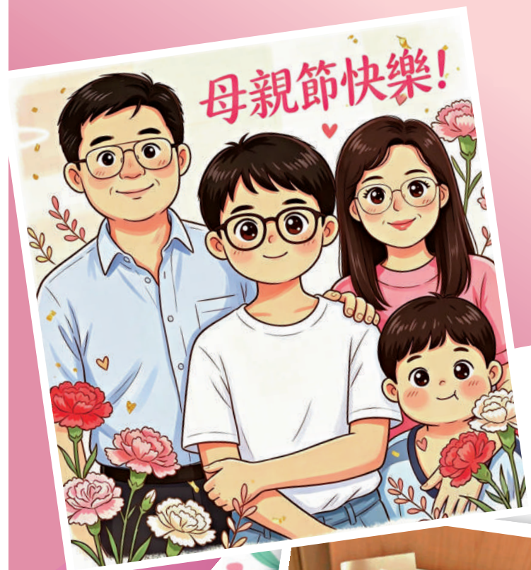
▲李家超發布以AI生成的母親節賀卡，祝願大家母親節快樂。