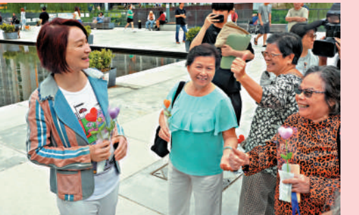
▲立法會主席李慧琼聯同協調小組的部分議員落區，向市民派花。

李慧琼指出，議員亦重視調研工作。作為立法會主席，她已經兩次「帶隊」到北都考察；兩個星期後就會進行第三次北都考察。各政策範疇的事務委員會和不同議員，亦經常接觸界別、落區調研。全體議員已經分別於六個