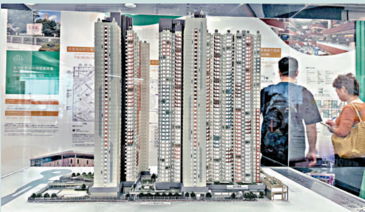
▲今年的五大新居屋屋苑中，包括啟德啟陽苑。