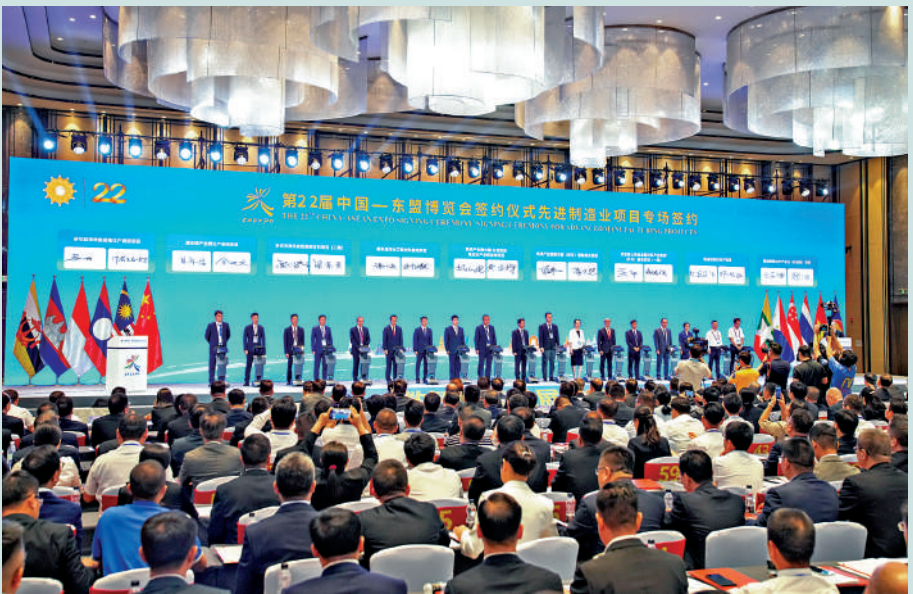
▲中國與東盟多國去年在廣西南寧簽署44項AI合作協議。