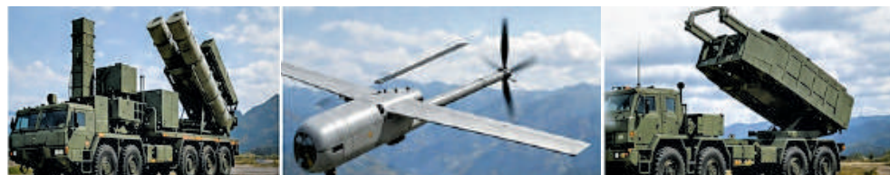
▲台當局7800億元預算將向美方購買防空導彈、無人機和「海馬斯」系統等武器裝備。