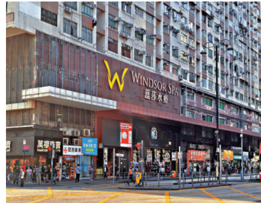
▲油麻地銀主盤美迪寧廣場舖以3.1億元沽出，蝕讓約63%。

另外，觀塘海濱道135至137號宏基資本大廈11樓及12樓全層，原由內地投資者於2014年及2017年分別以約1.18億元及約1.28億元購入，物業於2024年底被銀主接管，新近各以約6000萬元及約6610萬元易手，蝕讓幅度均約50%。