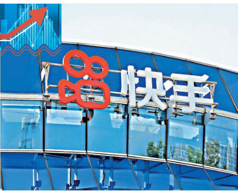
▲受惠人工智能快速發展，快手股價有望上揚。

過往市場認為人工智能(AI)的經濟效益僅限於提升生產及營運效率，但近年全球AI發展顯示，其對經濟的拉動廣泛，不亞於汽車製造業，涵蓋建築、電力裝備、半導體及軟件等領域。本周專家推介的股份包括壁仞科技(06082)、快手(01024)及中廣核電力(01816)，三者均可受惠於AI快速發展。