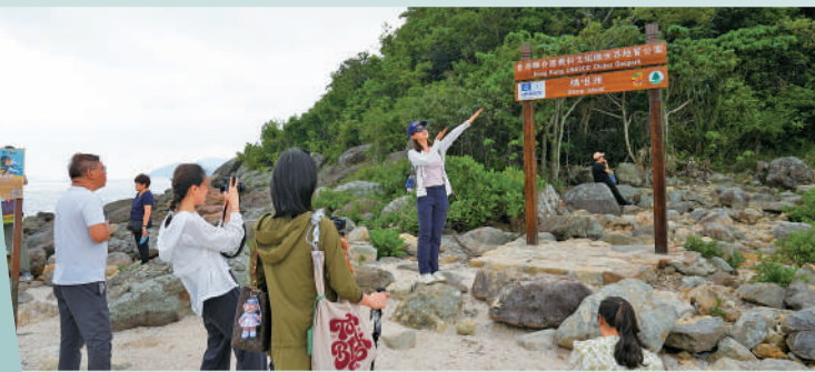
西貢東壩的洲界是聯合國公園文織認的。