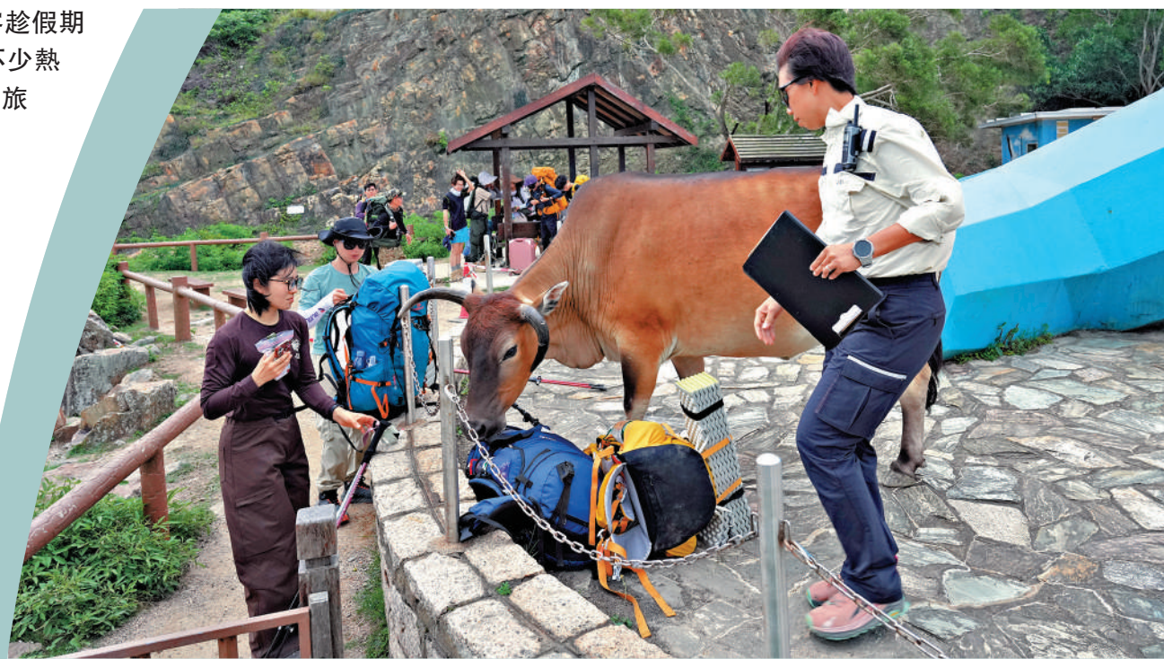
西貢東壩牛隻靠近遊人，漁護處人員在場協助解圍。

漁護署表示，會參考是次黃金周及以往長假期的經驗，透過增加及調派人手，適時加強郊野公園內熱門地點的巡邏及執法工作，以加強打擊違規活動。署方亦會持續透過不同渠道，包括內地社交平台等，加強向遊客進行宣傳教育。