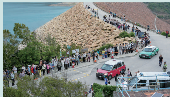
▲ 壩壩在假期遊人不絕，自然環境及交通狀況承受很大壓力。