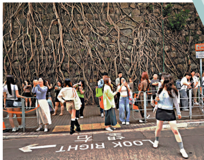
▲ 為拍攝西環百年石牆樹，不少遊客走出馬路，早發生意外。

根據香港法例，所有旅客在未獲入境處處長批准前，均不得在港從事任何有薪或無薪的僱傭工作，開辦或參與任何業務。違例者一經定罪，最高可被判罰款5萬元及監禁2年。而