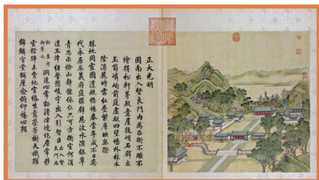
▲展現圓明園昔日盛況的《圓明園四十景圖》於1860年被法國掠奪。