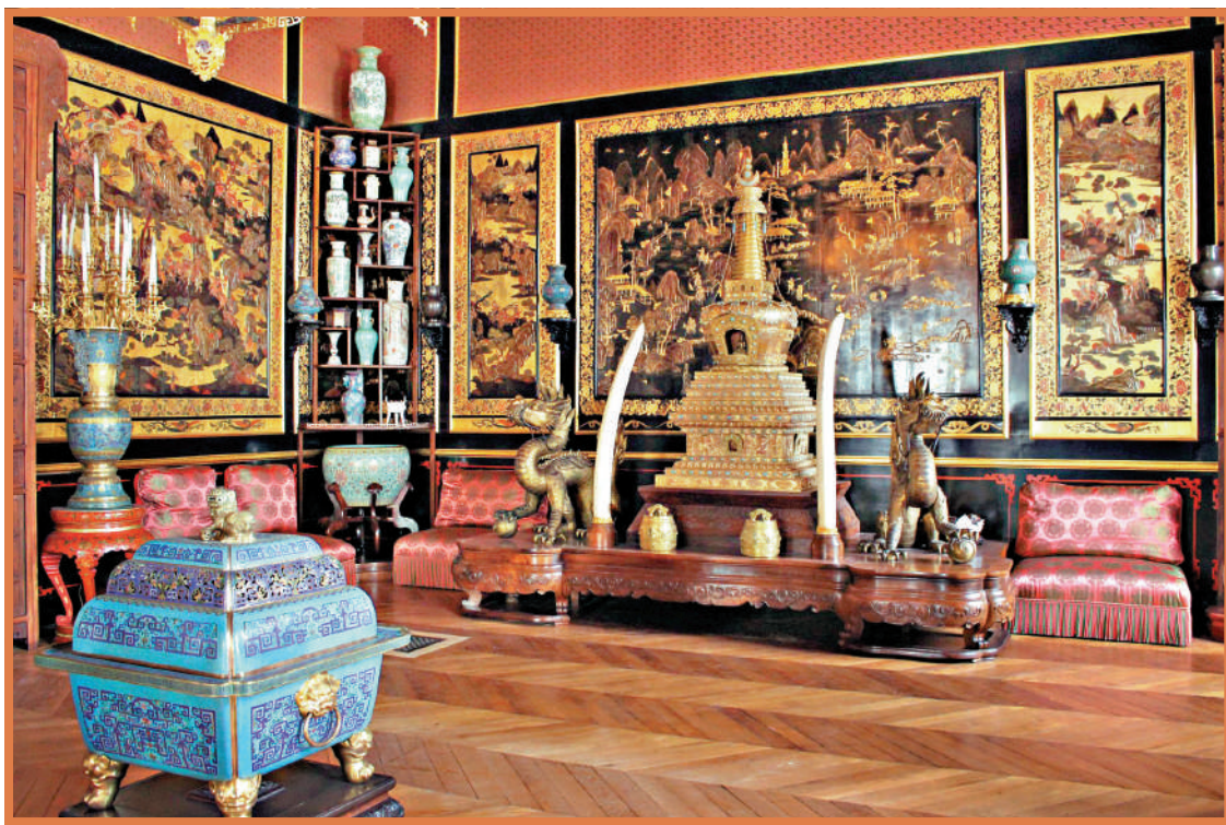
▲法國簡化非法所獲文物歸還程序後，一批圓明園文物有望返還中國。圖為法國楓丹白露中國宮所藏圓明園鎏金佛塔等中國文物。

據新華社報道，法國參議院7日以343票贊成、0票反對的投票結果，通過一項旨在簡化非法所獲他國文物歸還程序的法律草案。草案文本此前由議會兩院對等混合委員會協商達成一致，已於6日在國民議會表決通過。至此，該法案在法國議會最終審議通過。