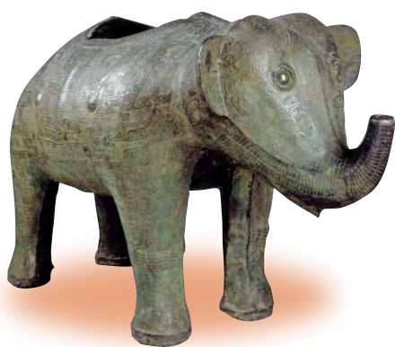
▼現藏法國吉美博物館的商代象尊。