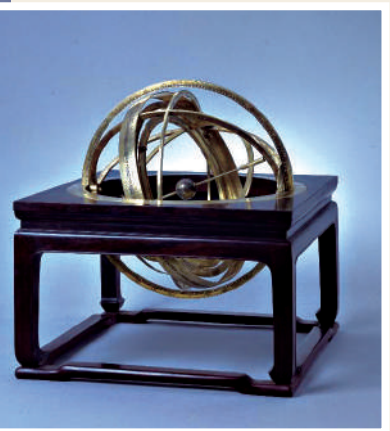
▲銀鍍金南懷仁欸渾天儀。