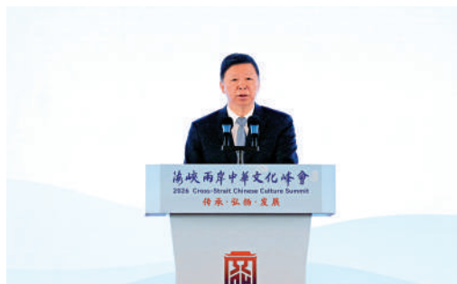
▲中共中央台辦、國務院台辦主任宋濤在第三屆海峽兩岸中華文化峰會上致辭。

國民黨副主席張榮恭指出，唯有兩岸人民的交往擁有共同文化基礎，這就是兩岸交流的特色，因為有共同的中華文化。「我們作為道地地地的台灣人，根據我們的文化基因，也應該是堂堂正正的中國人。」