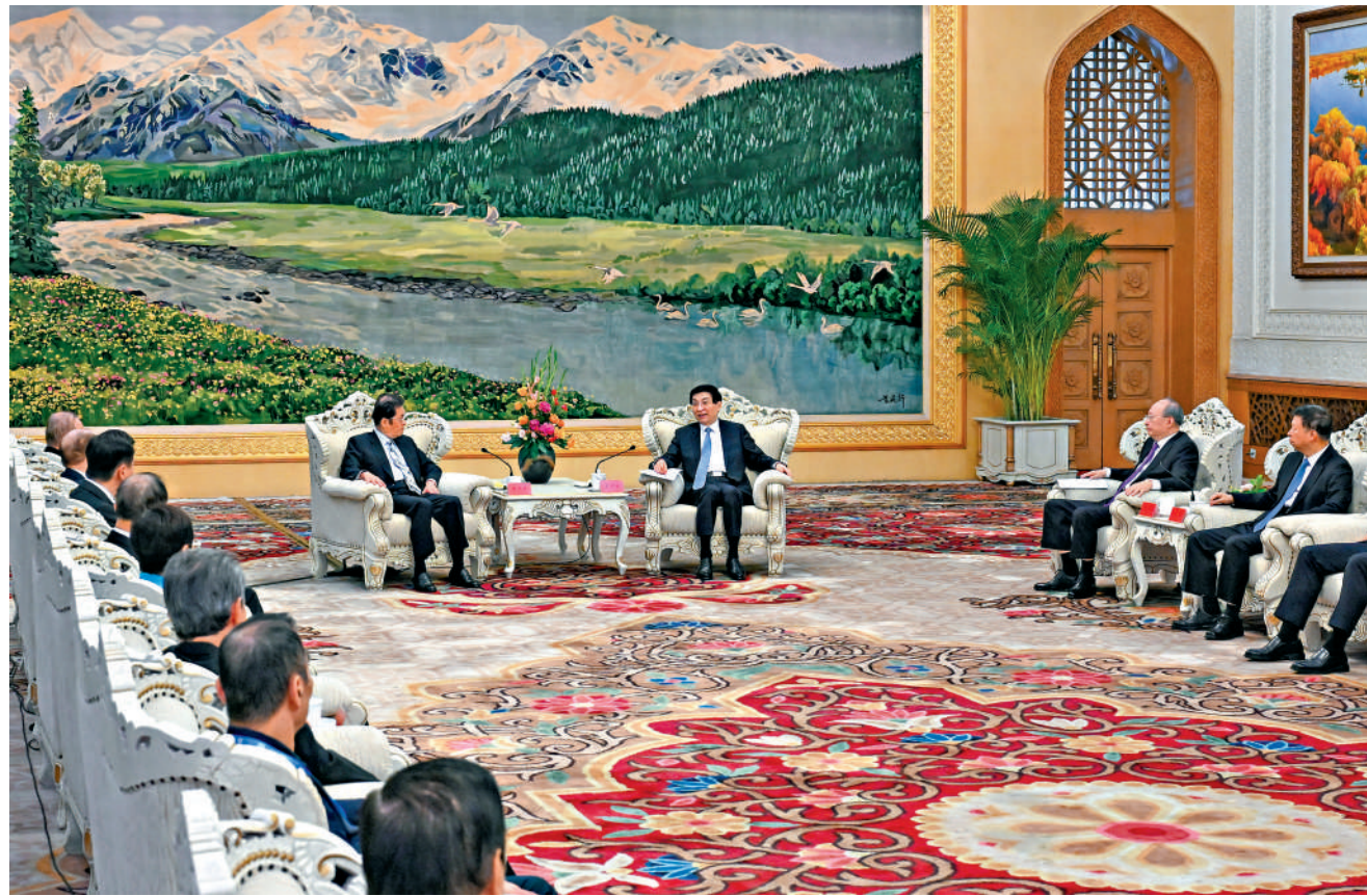
▲5月11日，中共中央政治局常委、全國政協主席王滬寧在北京會見中國國民黨副主席張榮恭和第三屆海峽兩岸中華文化峰會兩岸文化界人士代表。