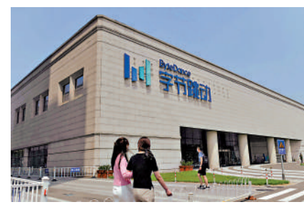
▲短片分享平台TikTok母企字節跳動據報將對AI基礎設施支出加碼2000億元人民幣。

根據QuestMobile數據，今年首季，豆包月活躍用戶規模達3.45億。另據火山引擎4月初披露，豆包大模型日均Token調用量已於3月突破120萬億，較2024年5月首次推出時增長1000倍。