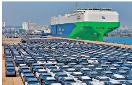
▲中國上月汽車出口逾90萬輛，按年增長74.4%。

另外，乘聯會數據顯示，4月新能源乘用車企業總體走勢較強，新能源月度批發銷量突破萬輛的廠商達到20家，同比多3家及環比多1家，佔新能源乘用車總量93%。