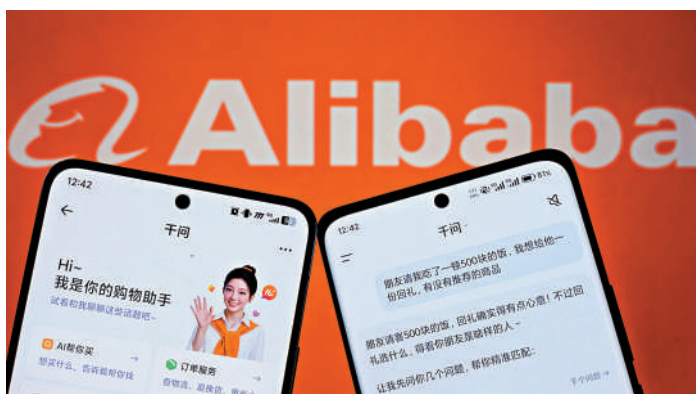
▲千問接入淘寶後，AI助手可為用戶提供更個人化的購物建議。

千問app在今年初已測試淘寶少量商品品類，今次全面互通所有品類，並通過配備訂單管理、物流追蹤及售後服務等技能庫的AI agent能力。用戶通過自然語言對話，便可完成整個購物流程，涵蓋商品發現、比較、下單、售後等各個步驟。