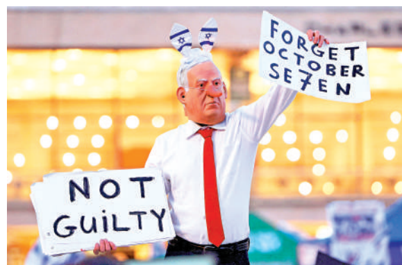
▲以色列反戰示威者9日舉着諷刺內塔尼亞胡的標語，要求結束伊朗戰事。

【大公報訊】據美國哥倫比亞廣播公司報道：以色列總理內塔尼亞胡在美國哥倫比亞廣播公司(CBS)10日播出的專訪中聲稱，與伊朗的戰事「尚未結束」，強調必須先移除伊朗的高濃縮鈾並拆除相關設施。這與美國總統特朗普表態不一致，凸顯美以分歧。