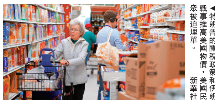
▲特朗普的關稅政策，美國民眾被推高物價，美國民眾不滿。圖為美國民眾在超市購物。

隨着伊朗戰事延宕，美國國內要求盡快停戰的聲浪越來越大。特朗普政府面臨內部壓力，與以色列的矛盾日益公開化。內塔尼亞胡告訴CBS，現在是重塑以色列和美國之間財政關係的合適時機，以色列希望在未來10年內擺脫對美國軍事援助的依賴。他表示，以色列每年收到38億美元(約296.4億港元)的美方援助，應制定一個以美雙方認可的時間表，逐步結束接收美國的軍事援助。以色列打算向國防預算追加3500億新謝克爾(約9424億港元)，用於在本土生產彈藥。