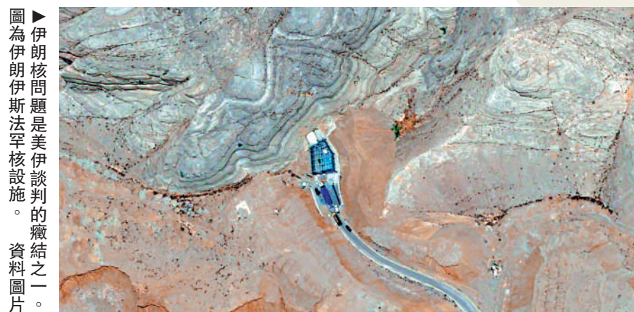
圖為伊朗核問題是美伊談判的癥結之一。資料圖片。

伊朗新聞電視台10日晚報道，伊朗已拒絕美國提出的停戰方案，認為同意該方案將意味着伊朗屈從於特朗普的過分要求。特朗普當天在社交媒體發文表達對伊朗回應的不滿，稱其「完全不可接受」。特朗普指責伊朗幾十年來一直反覆「拖延」，「戲弄」美國及其他國家。他還藉機猛烈抨擊美國民主黨籍前總統奧巴馬和拜登的政策，稱與伊朗達成核協議的奧巴馬是「冤大頭」，稱拜登比奧巴馬更糟。特朗普11日接受美媒採訪時稱，他會繼續與伊朗政府談判，「他們會屈服的」。特朗普再次聲稱，美國可能重啟引導霍爾木茲海峽被困船隻的「自由計劃」，且重啟後的行動將「力度更大」。他還聲稱，伊朗的最新回應在核問題上做出讓步，但「還不夠」。此說法與伊朗表態不符。