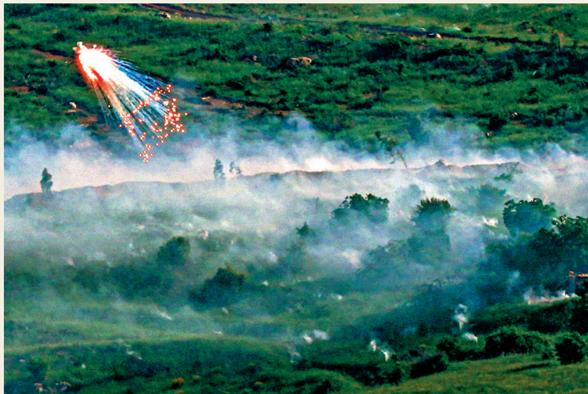
▲以色列持續襲擊黎巴嫩，為中東局勢增加不確定性。圖為以軍10日向黎巴嫩發射疑似白磷彈的彈藥。