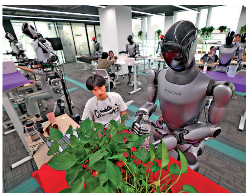
▲內地啟動AI科技倫理審查與服務先導計劃。圖為鄭州一位訓練師在訓練機器人。

「中國未來需要走出一條「發展與規範並重」的中間道路。既要守住不發生系統性倫理風險的底線，又要為技術創新預留充足空間。隨著這套治理體系逐漸成熟，才能培育出更安全、更可信的AI產品。」他說。