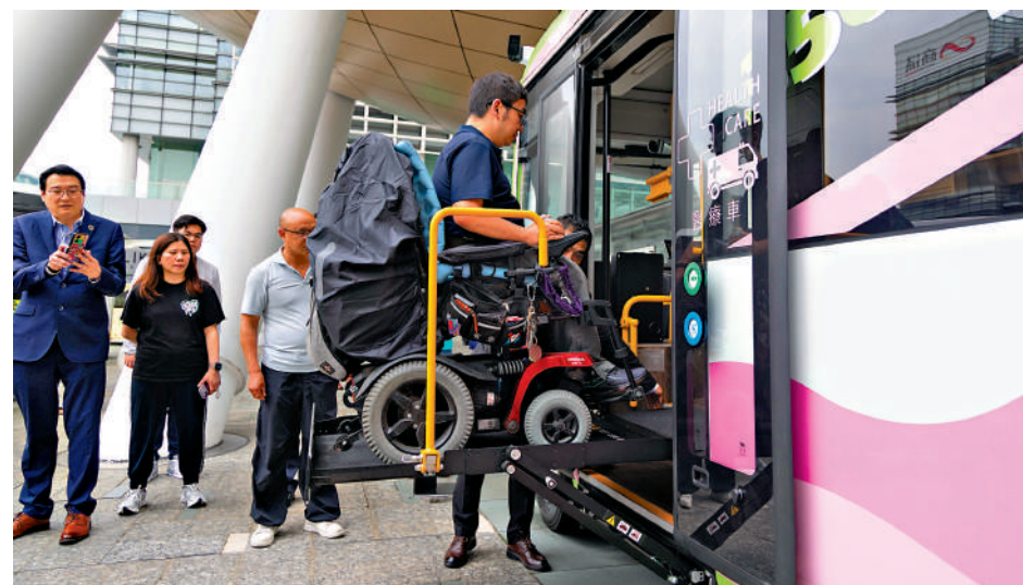
▲流動醫療車車款基於電動小巴底盤延伸開發，配備專用的電動輪椅升降機及醫療設備空間。