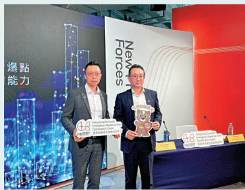
▲香港網絡安全事故協調中心公布跟進工作，建議各院校及早建立應變機制。