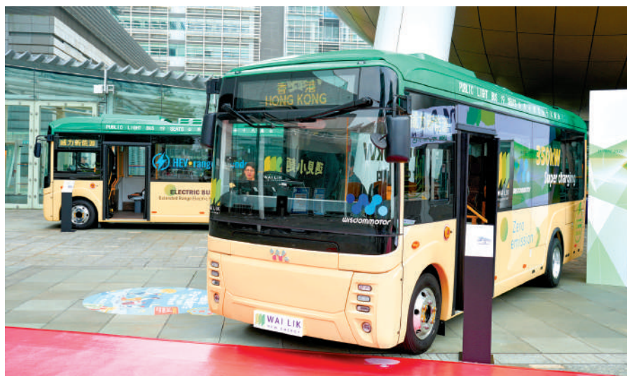
▲本地企業與內地車廠共同研發新一代電動小巴，料年內推出後先行走葵青區路線。