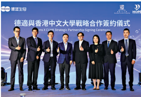
▲中文大學卓越婦兒健康研究所與杭州德適生物科技股份有限公司簽署合作備忘錄。

表示，本次合作可推動醫學影像大模型從技術研發走向臨床應用，並探索科研成果轉化的可持續路徑。