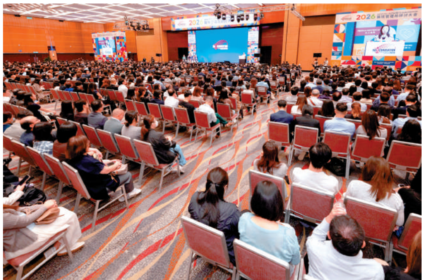
▲「2026醫院管理局研討大會」昨日起一連三日以現場及線上轉播形式舉行。

另外，瑪麗醫院及葛量洪醫院，前年起為65歲或以下的年輕晚期癌症病人推行先導計劃，跨專業團隊為他們提供為期八星期的紓緩治療服務，包括針對性痛症治療、復康計劃及營養評估等。截至去年6月，共有11名病人參與，平均年齡為40至50歲。根據臨床數據，九成病人完成計劃後認為更有信心管理病情，近四成表示有助減少痛楚及不適等症狀，32%病人減少抑鬱情況，13%減少焦慮。