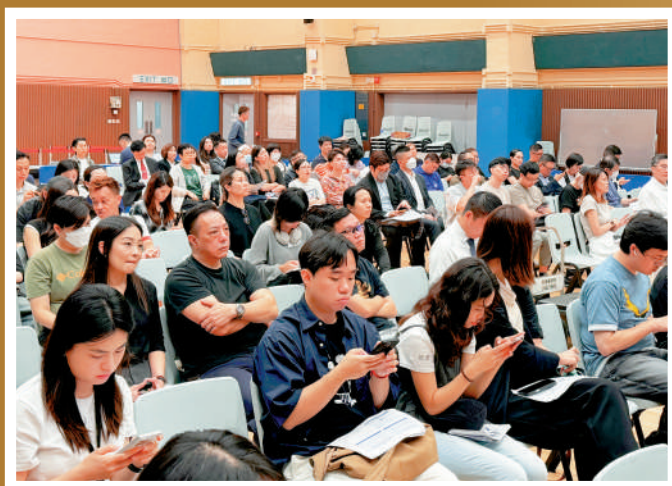
▲食肆下周一可提交容許狗隻進入的申請，食環署昨日為業界舉辦首場簡介會。

▶食環署表示，希望允許狗隻進入食肆措施在保障食品安全和環境衛生的同時，為業界經營提供最大彈性。