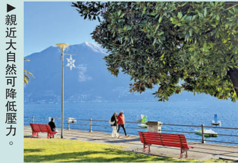
親近大自然可降低壓力。

在當下的社交媒體語境中，「戒斷反應」幾乎成了一種情緒修辭。有人吃了一頓精緻料理，旅遊幾天歸來，或沉浸於一場演唱會之後，便在網上感慨「需要戒斷」。這種表達就是對短暫愉悅的放大與延宕，是一種帶有表演性的情緒抒發，甚至可說是無病呻吟。