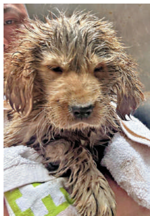
▲病重幼犬患有末期狗瘟，病情嚴重，已被安樂死。

旺角警區刑事調查隊第十隊督察葉皓霖表示，在兩人單位發現另外三隻狗，懷疑有人在網上平台購買狗隻，非法走私來到香港，三隻狗經獸醫檢查健康正常，暫時交由愛護動物協會照顧。