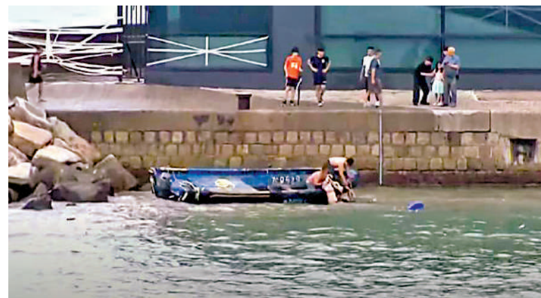
▲超強颱風「樺加沙」去年九月襲港，一對父母帶同幼子到柴灣海邊觀浪，幸獲救起。

兩人同意案情指出，母子被浪捲落海後一度失去知覺。兒子送院後有多處傷勢，其中右邊頭部血腫、出現約四厘米長見骨白的裂傷。他亦被診斷出有吸入性肺炎，在案發一週後出院。當日政府多次呼籲市民遠離海岸及危險區域，切勿追風觀浪。