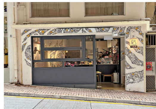
▲近年隨着多間風格獨特的小店進駐，錦屏街已成功轉型為北角的「隱世美食街」。