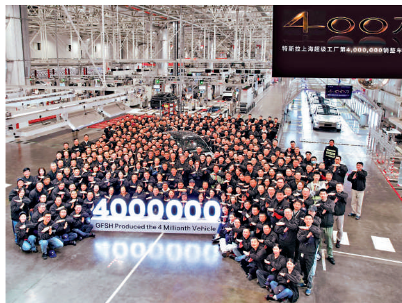
▲美國總統特朗普於5月13日至15日對中國進行國事訪問。據外媒披露，白宮已邀請特斯拉創始人兼CEO馬斯克隨行。圖為特斯拉上海超級工廠第400萬輛整車下線。

針對即將舉行的中美元首會晤，聯合國秘書長副發言人哈克11日表示，聯合國讚賞中美兩國保持對話溝通。作為世界兩大主要經濟體，中美妥善處理分歧，將有利於世界穩定和經濟發展。