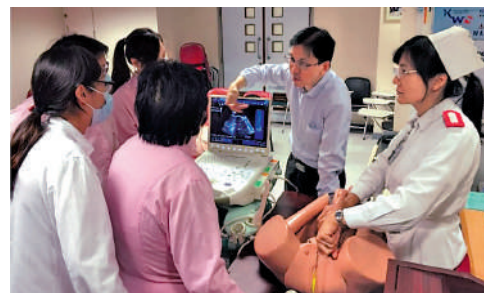
▲廣華醫院產科由2018年起試利用床邊超聲波，輔助醫生排除及辨識產科併發症。

【大公報訊】記者戴靜文報道：公立醫院產後出血個案近年有上升趨勢，2024年升至17.1%，相信主要與高齡懷孕及剖腹產後增加有關。醫院管理局自去年起，向所有在公立醫院剖腹生產的孕婦，處方預防性子宮收縮藥物，降低產後出血比率。另外，廣華醫院產科近年試用產程超聲波，提升分娩過程的安全性。