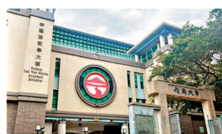
▲嶺南大學計劃擴建校園，提出放寬可建樓面面積。

北校園，樓面由2360平方米，增加44倍至105042平方米。兩幅用地將分期進行擴建，提供教學及研究設施、實驗室、辦公室、文康設施、餐飲及宿舍設施等，並已獲教育局政策支持；規劃署表示，大學已經就擴建計劃進行交通、環境、排污、排水、供水、樹木、視覺、空氣流通等技術評估，預計實施緩解措施後，不會對周邊環境造成重大或不良影響。 大部分出席會議的區議員皆支持嶺大擴建計劃，但關注擴建後的社區承載力及交通配套問題；又要求校方開放設施予社區使用。