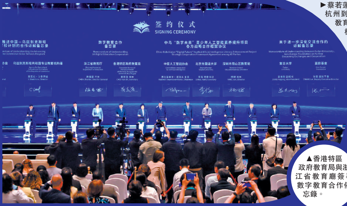
▶蔡若蓮前日在浙江杭州到訪人工智能教育應用試點學校杭州春暉小學。