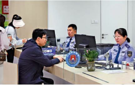
▲上海市民在上海市公安局的長寧分局出入境接待大廳申請辦理台灣通行證。

全市20個出入境接待大廳已同步啟動赴金門、馬祖旅遊簽注申請受理工作。上海市戶籍居民和居住證持有人，以及在福建的上海市戶籍居民可申辦。