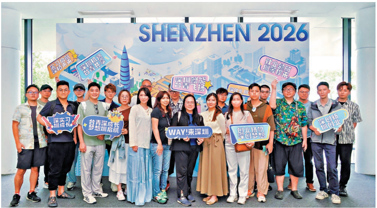
近年越來越多台灣青年人到大陸發展，增加了對大陸的認同和好感。圖為在深圳實習和就業的台灣年輕人合影。

廈門大學台灣研究院副院長張文生向《大公報》表示，此次民調數據直觀反映出中國國民黨主席鄭麗文參訪大陸後，台灣民意出現積極轉變。縱觀島內