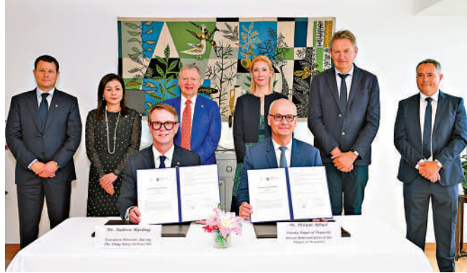
▲馬會與多維爾市簽署合作備忘錄。

爾市將規劃馬球學習課程，並支持馬會會員參加將於每年8月在多維爾市舉行的亞洲馬球盃。