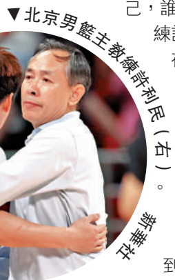
▲北京男籃主教練許利民（右）與隊員擁抱慶祝。