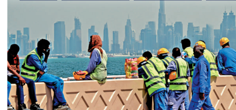
▲海灣石油富國也受戰爭影響，圖為迪拜工人在休憩。