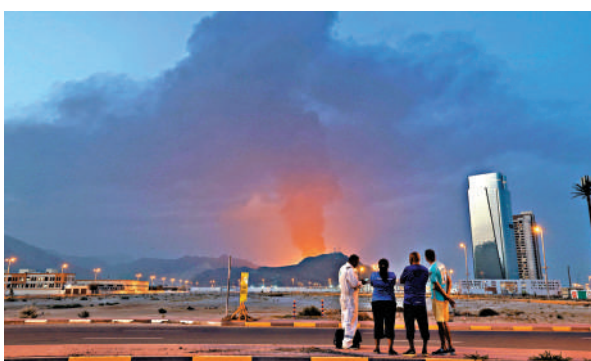
▲中東產油國阿聯酋富查伊拉工業區3月受襲，現場濃煙滾滾。

用於印刷的油墨材料生產所需的溶劑、樹脂等關鍵原料均來自石腦油。日媒此前報道稱，日本知名食品企業卡樂B已通知其供應商，將從5月下旬起，把薯片等部分主要產品的包裝由彩色改為黑白兩色。