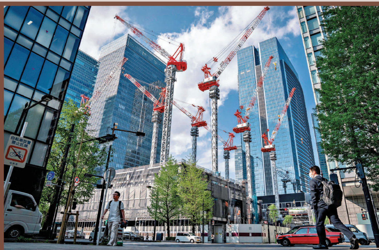
▲由於建築材料等供應受阻，日本部分建築項目受影響。