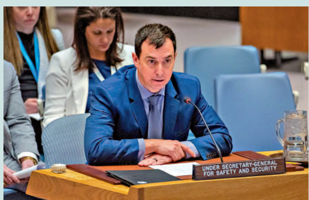
▲聯合國負責安全和安保事務的副秘書長米肖。

後被帶到等候區，被盤問有關去年8月訪問加沙的情況。直到約45分鐘後，米肖才被釋放。