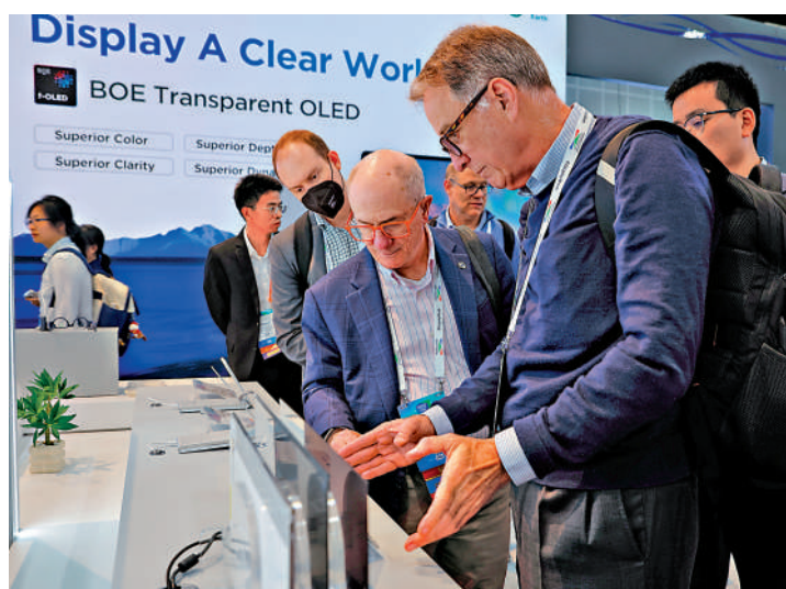
▲5月5日，在美國洛杉磯，人們在「國際顯示周」上參觀來自中國顯示屏巨擘京東方展台。