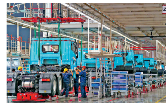
▲中美合作共贏，有利全球經濟發展。圖為長沙一條重卡智能生產線。

刁大明強調，美方對華戰略競爭的敘事與戰略，是對中國發展的誤讀，也是對中美關係和當前世界格局的誤判。過去八年與過去一年的事實足以證明，中方一貫強調的「合則兩利、鬥則俱傷」的正確性。唯有合作，才是中美兩國唯一的正確選擇。中美兩國從自身利益、從全球福祉出發，完全可以保持合作而非對抗，追求雙贏而非零和，努力塑造正確相處之道，實現穩定共存與和平共處。