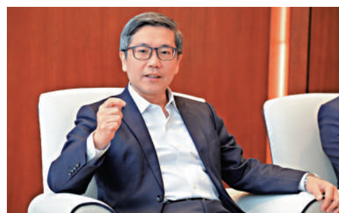
▲阮國恒表示，強制性背景查核計劃的背景查核，不止於銀行業。

阮國恒呼籲業界在實施前做好準備，加強內部溝通、提供員工培訓及優化招聘流程，確保安排暢順有序推行。他表示，金管局將繼續與其他監管機構探討把查核安排延伸至更廣泛金融領域的可行性，逐步擴大覆蓋範圍，讓良好操守成為金融從業員的「通行證」，促進香港金融業長遠穩健發展。