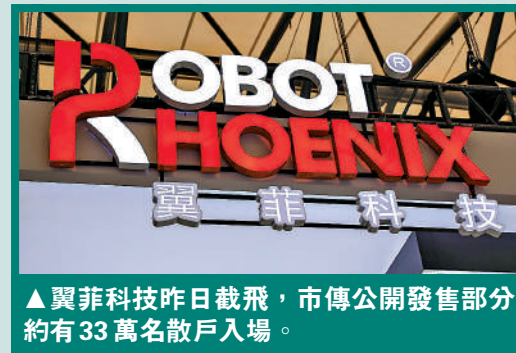
▲翼菲科技昨日截飛，市傳公開發售部分約有33萬名散戶入場。