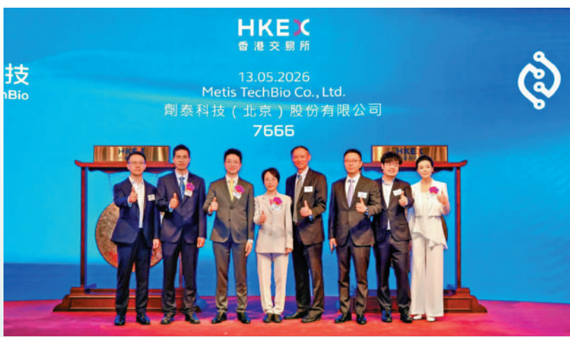
▲AI製藥三小龍之一的劑泰科技，昨日首掛大漲逾倍，表現搶眼。