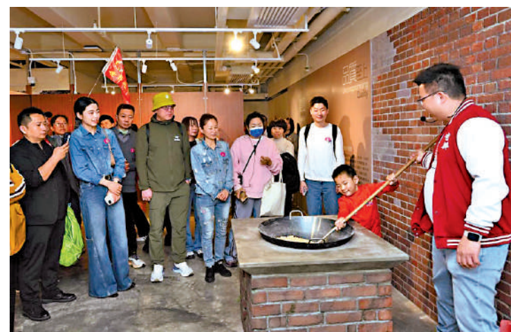
▲參與工業品牌旅遊的旅客正體驗傳統香港餅食的製作過程。

劉震表示，由於參與計劃的工業品牌廠房一直肩負工業生產任務，旅議會需與各品牌就承載力、開放時段及參觀安排作個別商討。對品牌而言，工業生產是業務重心，接待旅客必須在不影響生產流程的前提下進行。他續指出，工業旅遊有助提升品牌價值及知名度，可接待的旅客人數主要取決於品牌的接待能力、廠房空間及開放時段的限制，因此當局並不認為提供財政誘因能有效令更多旅客受惠。