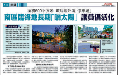
▲《大公報》去年曾報道田灣海濱一幅地長期閒置，並訪問地區人士提出發展建議。

政府可活化南區內包括該用地的不同空置地，為居民提供康樂設施，也為南區注入更多活力。