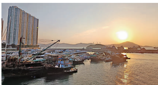
▲海濱新公園可供市民遊客欣賞日落海景。

動下，環境及生態局和漁農自然護理署正與魚類統營處和其他相關政府部門，研究於魚市場一帶加設新餐飲大樓的可行性，預期提供餐飲、零售及漁產品加工設施等。待有關研究完成後，當局會適時檢視推展安排。