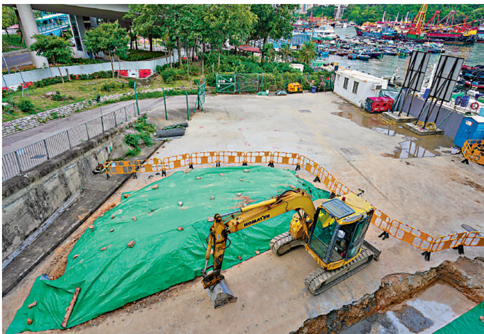
▲香港仔田灣海濱空置地多年，已納入「活力環島長廊」項目，成為駁通港島環島長廊其中一段，將美化成為海旁休憩空間。