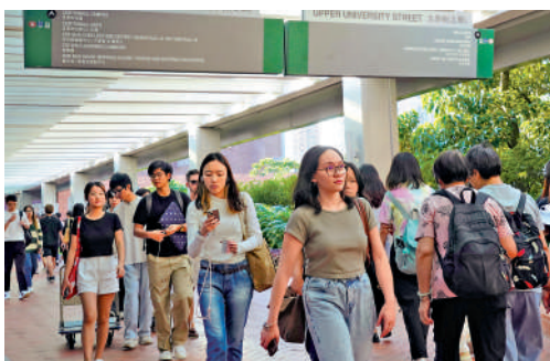
▲大學畢業生的全職職位空缺，由2022年約8萬個下跌到2025年約3.1萬個。

接近90%和80%。孫玉菡指出，政府非常重視相關情況，並一直密切監察本地勞動市場的變化，勞福局正分析AI對香港整體勞工市場及不同行業職位的影響，結果將會納入人力推算中期更新，預期今年第四季公布。他表示，本港八所資助大學將檢視和開設新課程，在2025年至2028年，會因應政府的政策指導、市場需求、行業趨勢推陳出新，開辦三十幾項新課程，包括人工智能、網絡安全、創意產業可持續發展、數據科學等。