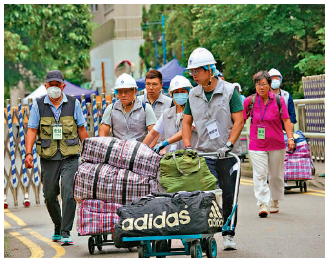
▲合安管理有限公司昨日表示，將向土地審裁處申請延長召開業主大會。圖為宏福苑居民日前回家執拾。

【大公報訊】記者戴靜文報導：大埔宏福苑業主立案法團管理人、合安管理有限公司昨日向宏福苑全體業主發信，表示為保障全體業主的權益，將向土地審裁處正式提交申請，就延長召開及舉行業主大會的法定時限，尋求清晰的司法指示。早前有業主要求業主大會議程包括討論原址重建，合安稱，部分議程事項涉及個案業主的個人財產權益，不宜於業主大會上討論及表決。