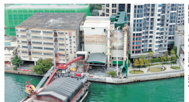
▲位於油塘東源街6號的混凝土廠計劃6月中旬全面停止運作。

發言人強調，環保署一直致力保護環境，過去數年持續跟進油塘區混凝土廠的環境問題，分別於2022年及2021年拒絕位於油塘東源街20號及22號的混凝土廠的牌照續期申請，並向該兩間混凝土廠的營運商發出共41張傳票提出刑事檢控，當中32項控罪被法院裁定成立，共罰款255000元。除了嚴厲執法外，政府亦積極推動修訂相關法例，並配合宣傳教育，為市民締造健康怡人的生活環境。是次東源街6號混凝土廠決定全面停止混凝土生產運作，標誌着油塘區最後一個大型水泥生產作業正式結束，對改善區內空氣質素及居住環境具有重要意義。