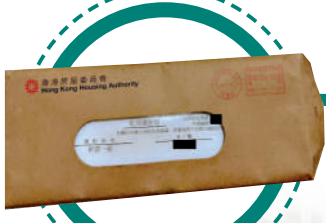
▲獲分配公屋單位的申請者，會收到「配房信」。

公屋聯會總幹事招國偉認為，公屋輪候時間得以紓緩，有賴「簡約公屋」的落成，2026及