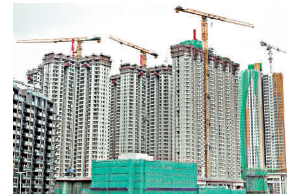
▲公屋供應持續增加，預期未來一至兩季輪候時間有進一步下調空間。

2027年仍有逾2萬個簡約公屋相繼落成，相信對於縮減輪候時間大有幫助。他建議政府進一步研究，向居於簡約公屋在內的居民，制定鼓勵自置居的措施，例如可優化綠置居計劃及租置計劃回收單位，豐富房屋階梯，提供更多住屋的選擇。