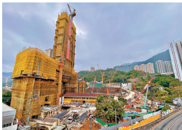
▲牛池灣清水灣道35號項目，將興建行人通道接駁港鐵彩虹站與彩雲邨一帶。

【大公報訊】記者王蕙如、李千泓報道：牛池灣清水灣道35號項目，早前申請興建行人通道接駁港鐵彩虹站與彩雲邨一帶。發展局昨日公布，行政長官會同行政會議批准豁免落實有關地價補償，及新增所需約334方呎總樓面面積申請，屬「促進私營機構提供行人連接計劃」批准的第9個申請。局方指出，擬議行人設施將大幅提升牛池灣整體聯繫度和步行舒適度，讓新舊發展項目合共約10萬名居民和就業人口受惠，預期為附近食肆和商戶帶來更多人流，促進地區經濟。