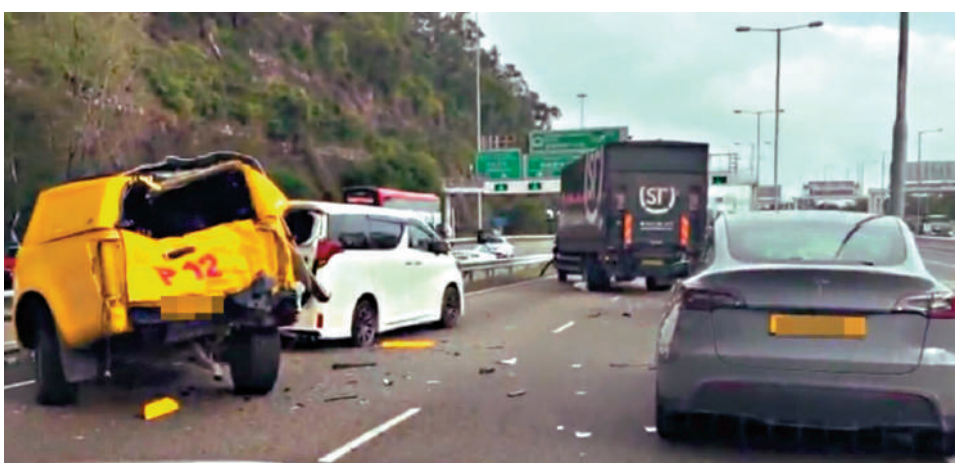
物流公司貨車撞向工程車及私家車，地上散滿碎片。

【大公報訊】記者戴東報道：長青公路近青馬大橋昨日發生嚴重車禍，一輛物流公司貨車撞向因事故停在路邊的工程車及七人車，工程車人員被捲入車底，意外最終釀成一死五傷。