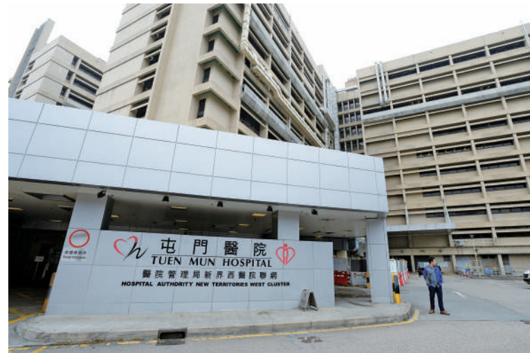
屯門醫院發生醫療事故，一名男病人在「通波仔」手術期間動脈出現氣泡，同日不治。

【大公報訊】記者戴東報道：屯門醫院發生醫療事故，一名75歲男病人在接受「通波仔」手術期間，冠狀動脈出現氣泡，隨後出現心跳減慢及血壓驟降情況，經急救後情況持續惡化，並於同日離世。院方在初步檢查中發現其中一條導管末端的螺旋嘴接口出現異常。院方將成立根源分析委員會作詳細調查，於八星期內完成報告並提出改善建議，有關個案亦已轉交死因裁判官跟進。