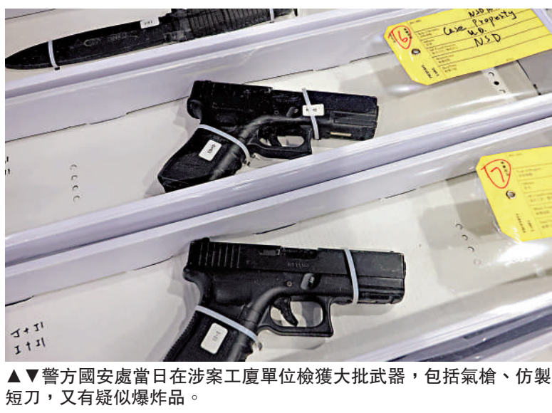
警方國安處當日在涉案工廠單位檢獲大批武器，包括氣槍、仿製短刀，又有疑似爆炸品。